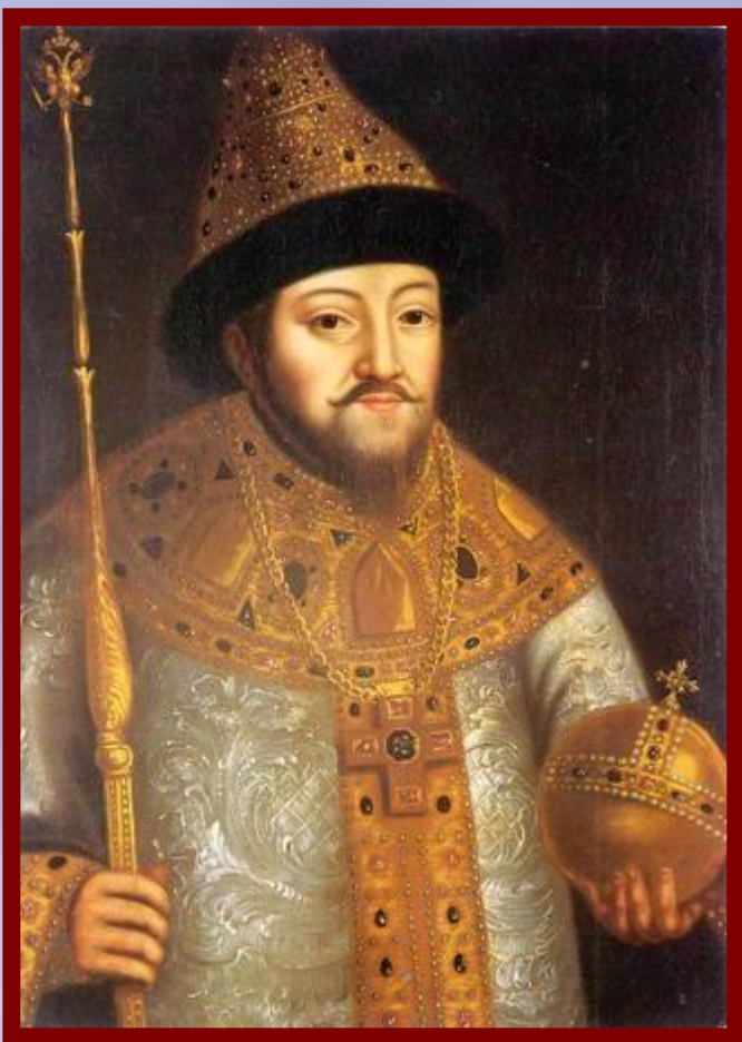
Царь Алексей Михайлович

Длительная кровавая Смута в начале века, массовые выступления горожан и крестьян: волнения в Новгороде и Пскове, Медный бунт, восстание Степана Разина – все эти события ознаменовали собой начало правления в России новой династии Романовых, и особенно – беспокойное царствование Алексея Михайловича «Тишайшего».