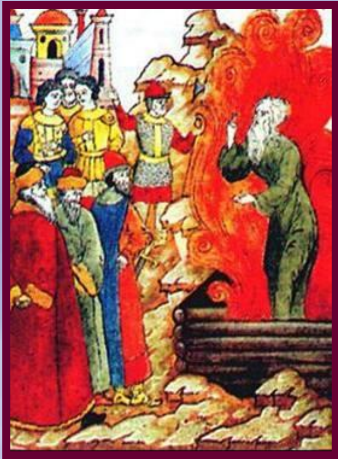
Сожжение протопopa Аввакума. Миниатюра конца XVII в.

Сопpотивление никонианским начинаниям возникло сразу после выхода новых исправленных служебников в 1654 году.