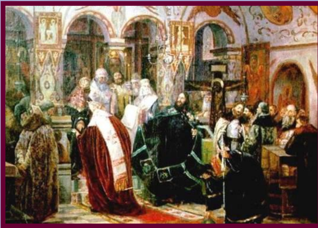
Лишение Никона на Соборе Патриаршего сана. Неизвестный художник (XIX век).

В 1666 г. царь пригласил в Москву четырех восточных патриархов и устроил суд над Никоном. Патриарх был осужден, лишен сана и заточен в монастырь.