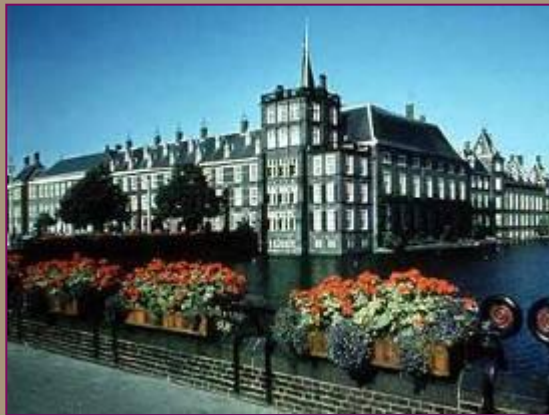
Здание парламента в Гааге

Монарх Нидерландов официально является главой государства, однако делегирует власть кабинету министров. С 1980 года королевой является Беатрикс из старинной Оранской династии, наследником престола - её сын Виллем-Александр.