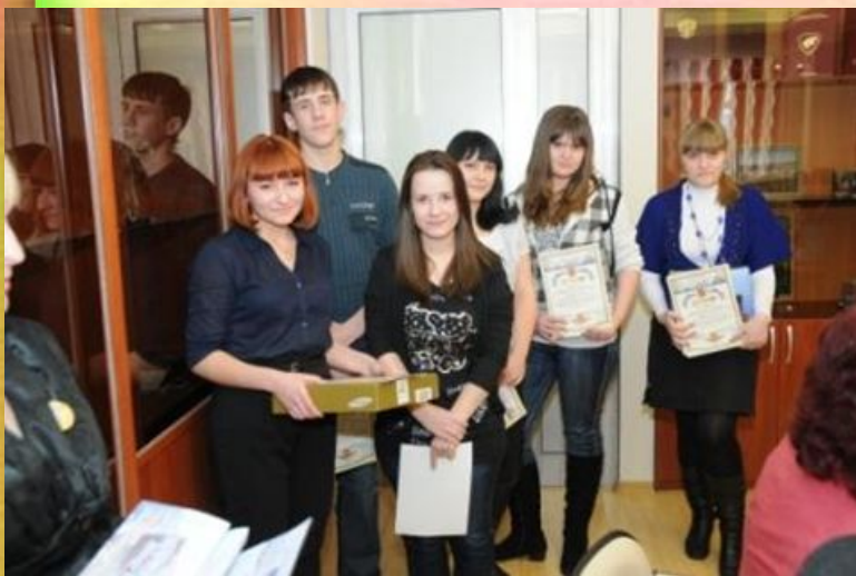
Победители и призеры секции