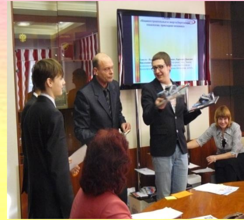
Награждения членами жюри победителей секции