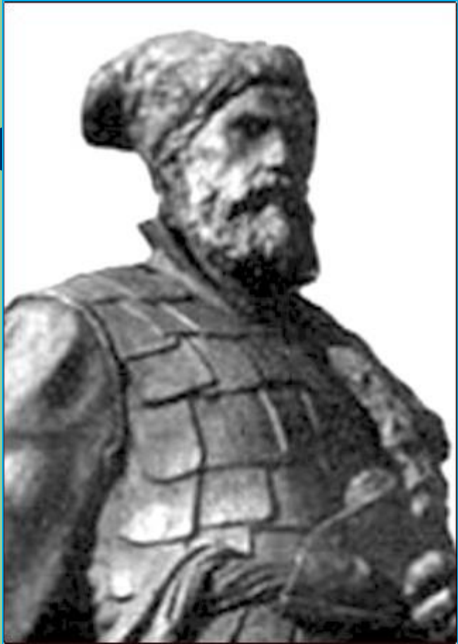
Ерофей Павлович Хабаров