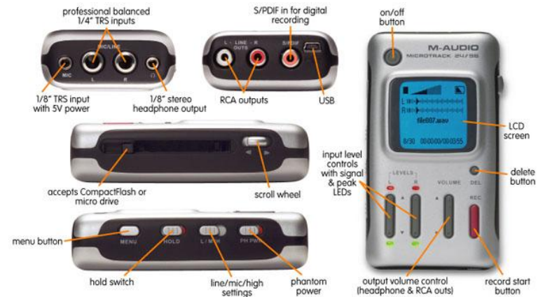
MicroTrack 24/96 Accessories