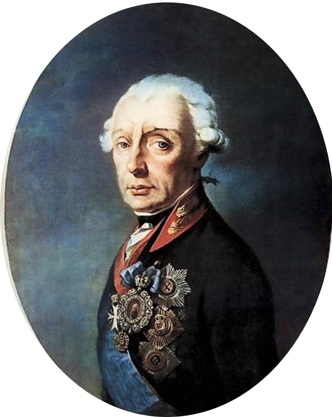
Суворов Александр Васильевич (1730-1800 )