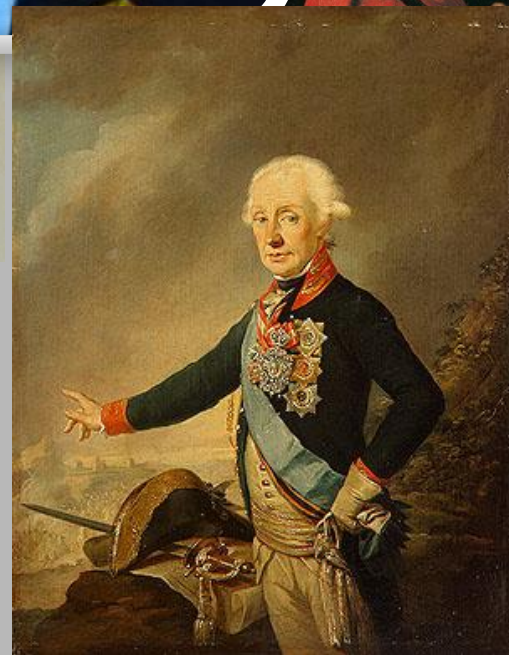
Портреты А.В. Суворова