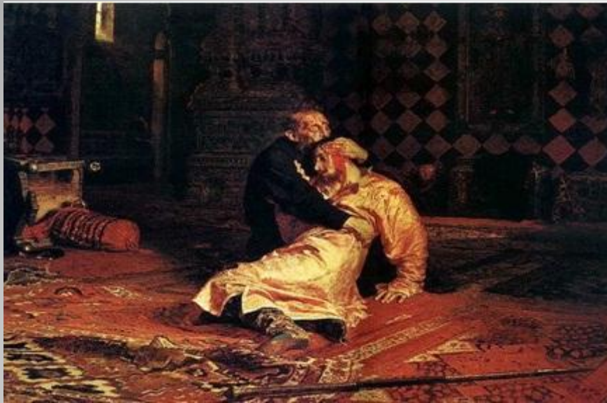
Илья Репин «Иван Грозный убивает своего сына»