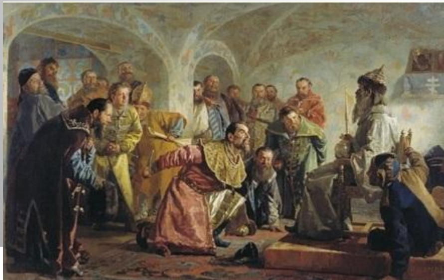
Невреев Н.В. «Опричники»