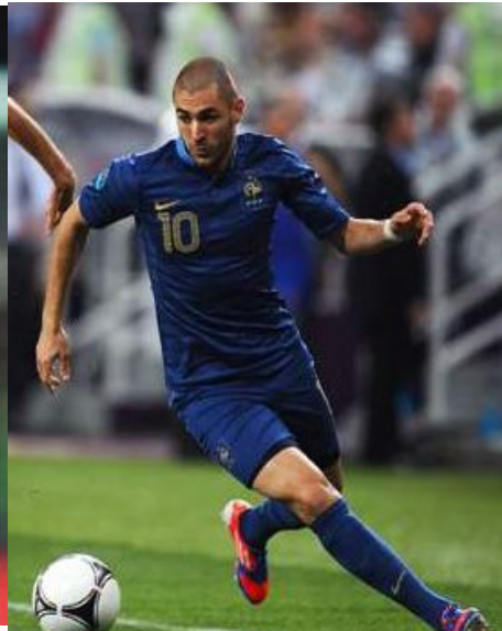
Iker Casillas (Испания), Karim Benzema (Франция), Lukas Podolski (Германия)