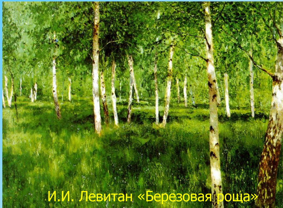
И.И. Левитан «Березовая роща»