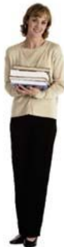
Преподаватели 70%