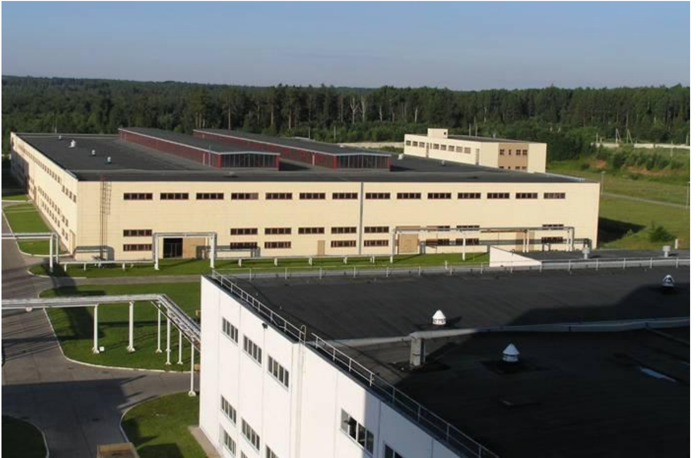
внешний вид здания