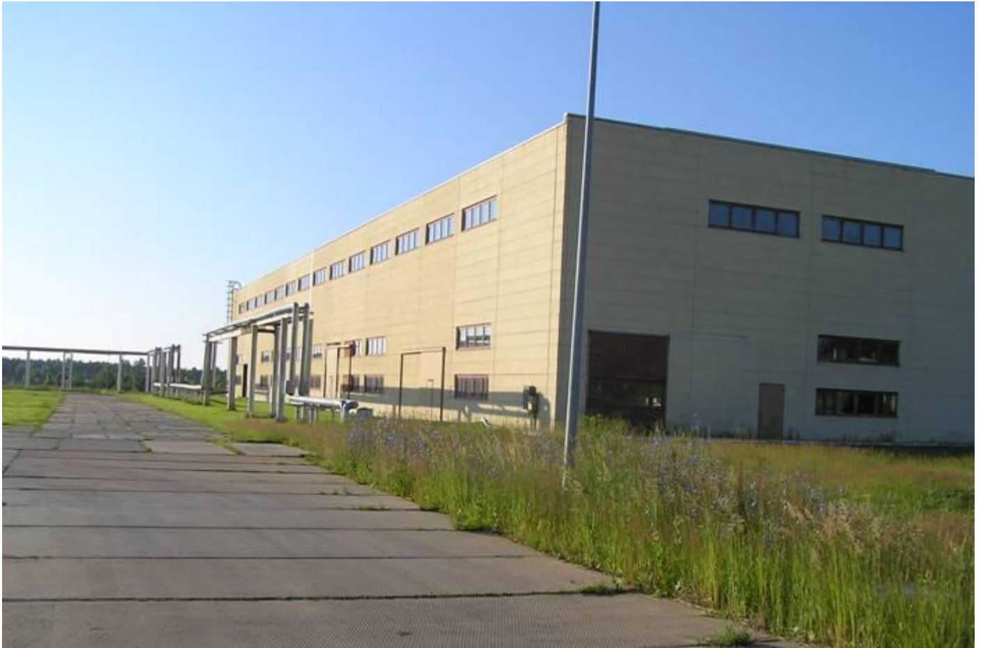
внешний вид здания