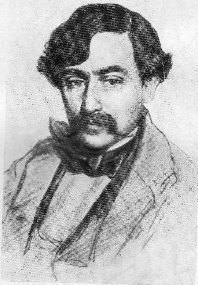
Иван Панаев, муж Авдотьи Яковлевны Панаевой