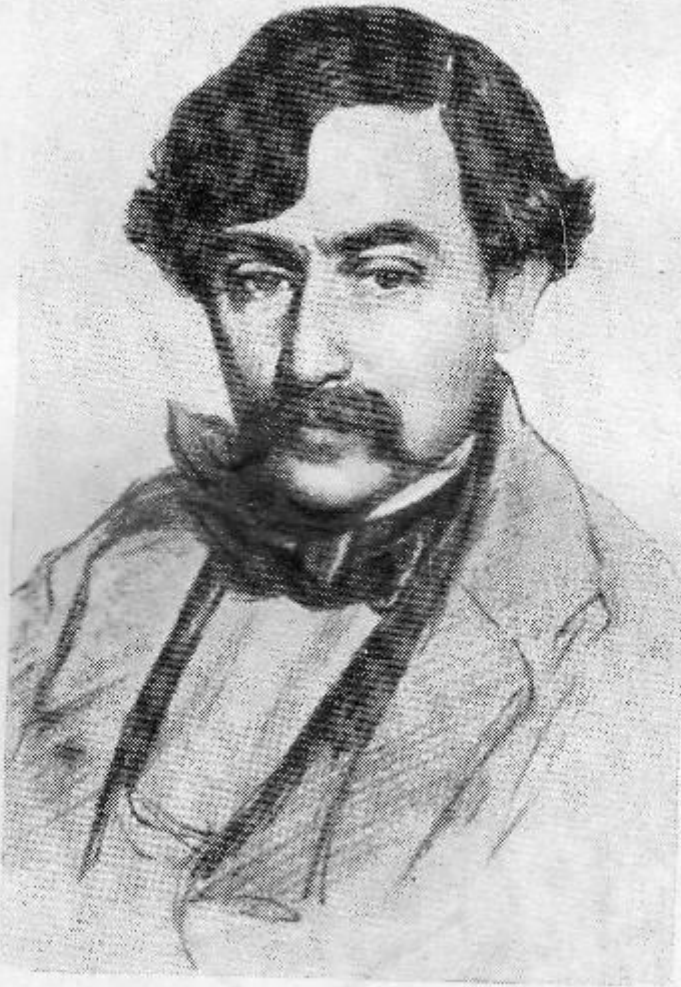
Иван Панаев, муж Авдотьи Яковлевны Панаевой