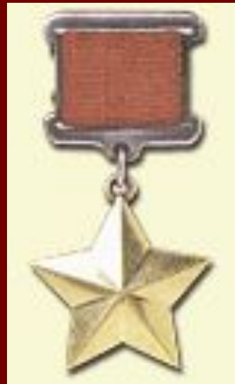
Медаль "Золотая Звезда"