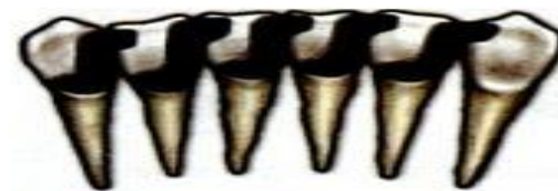
Шинирование вкладками на штифтовой основе