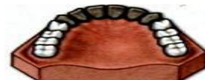
Цельнолитые коронки с облицовкой