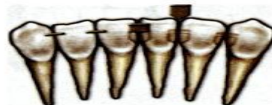
Шинирование при помощи вкладок