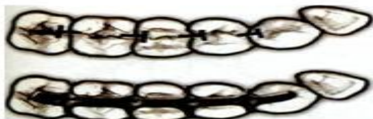
Шинирование жевательных зубов при помощи литых вкладок