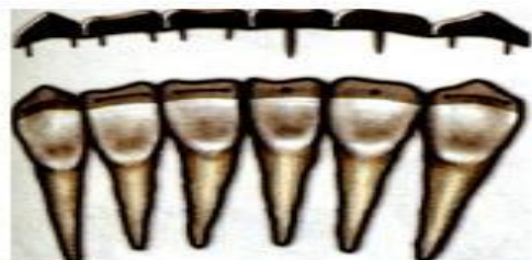
Несъемная комбинированная шина со штифтами