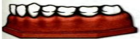
Литая шина на вкладках