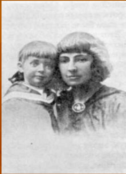
М. Цветаева с дочкой.