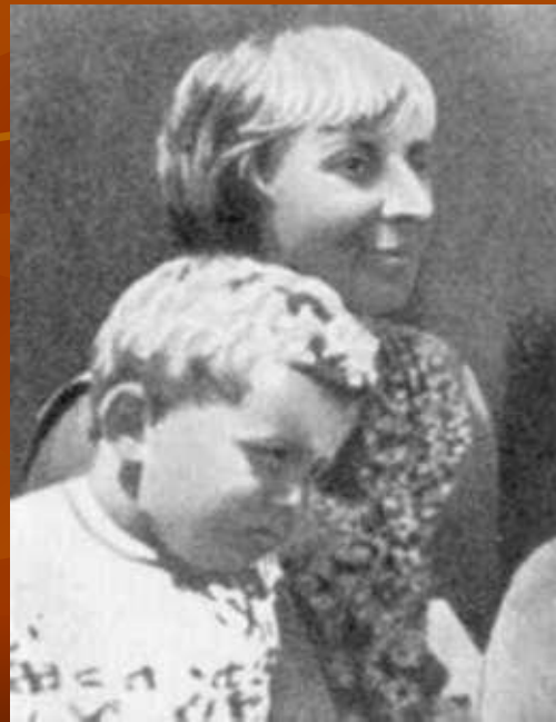
М. Цветаева с сыном.