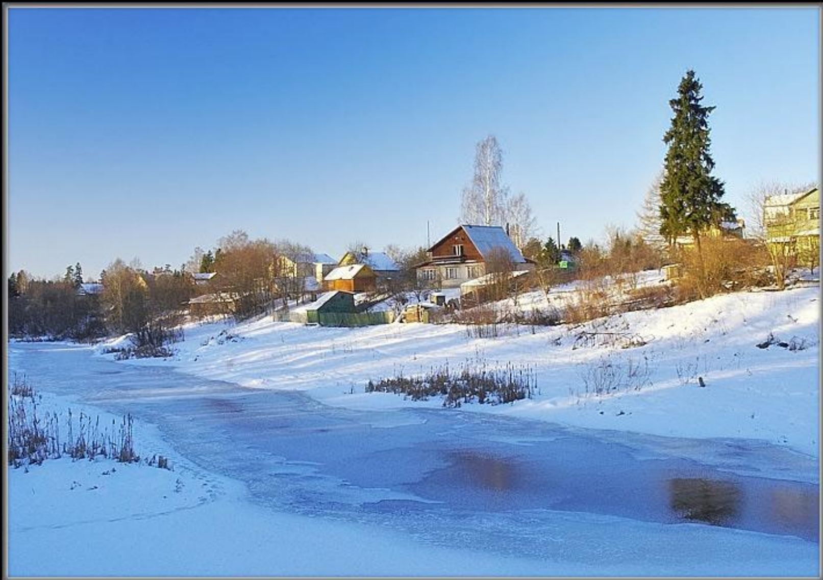
Yuriy Gogin (2006)