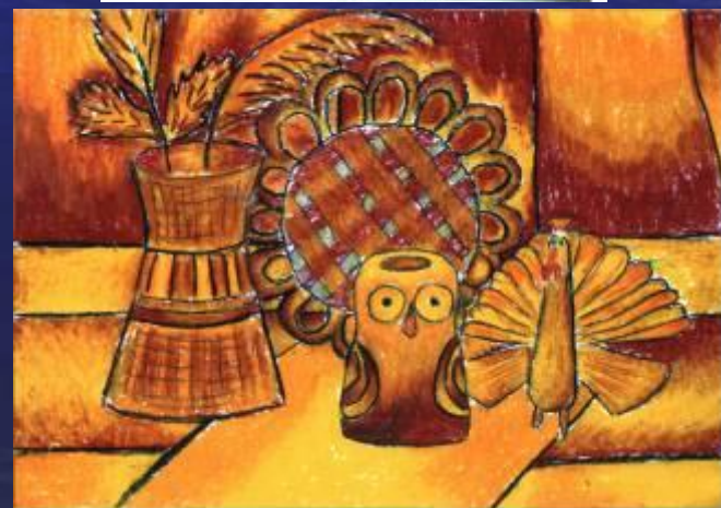
Натюрморт 1-ое место