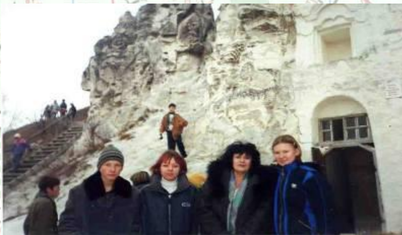
Поездка в Дивногорье