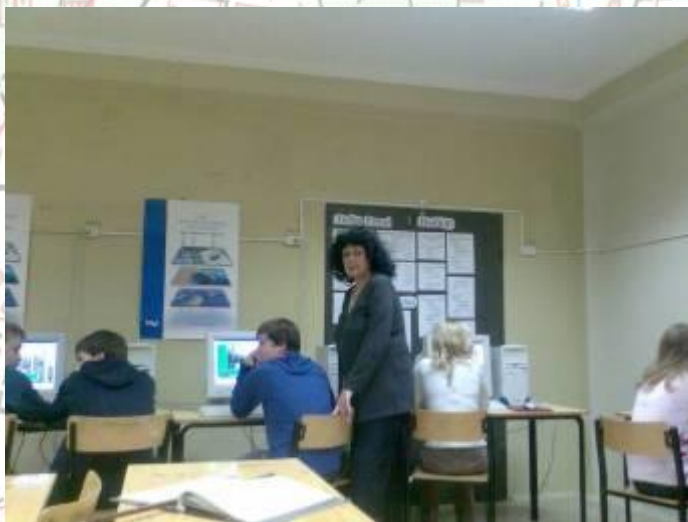
Компьютерный тест- контроль