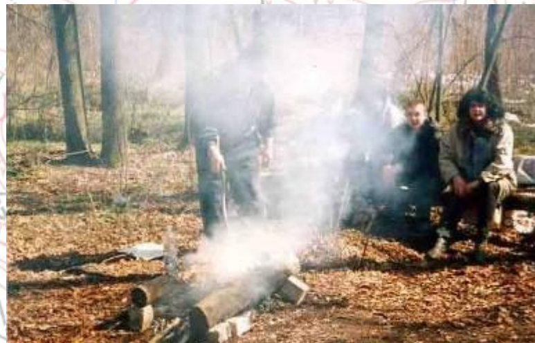
Поход в лес