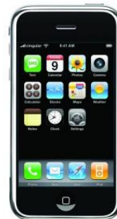
2007г. – Apple iPhone