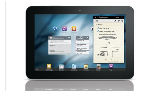
Samsung Galaxy Tab