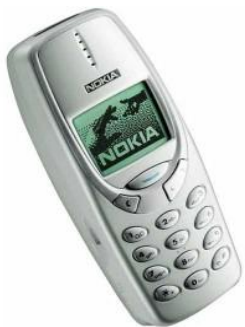
2000г. – Nokia 3310