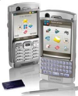
2005г. – Sony Ericsson P990i