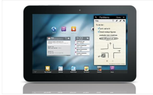
Samsung Galaxy Tab