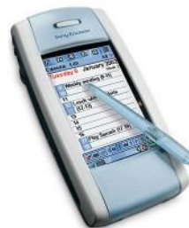
2003г. – Sony Ericsson P800i