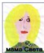
Тишина В, 1 «А»