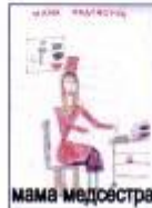
Тишина В, 1 «А»