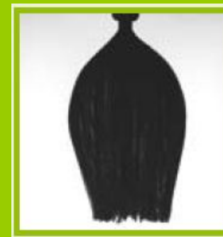
Обработанная Volumea прядь