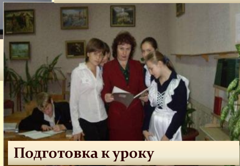
Подготовка к уроку