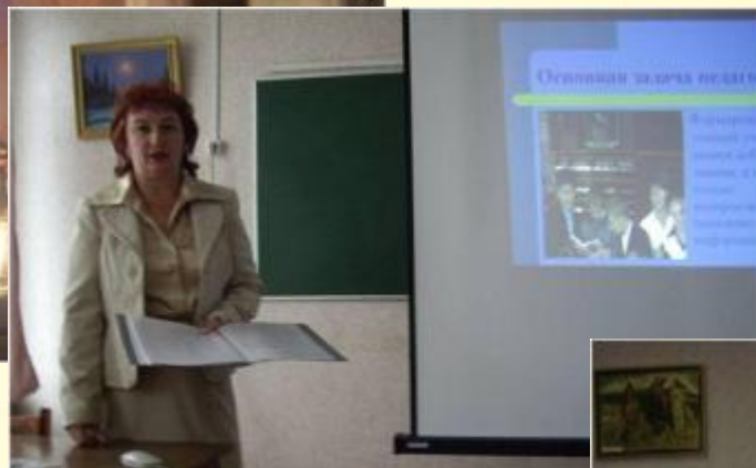
Выступление на фестивале