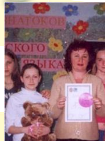
Победа в конкурсе