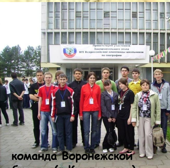
команда Воронежской области (г.Кисловодск)