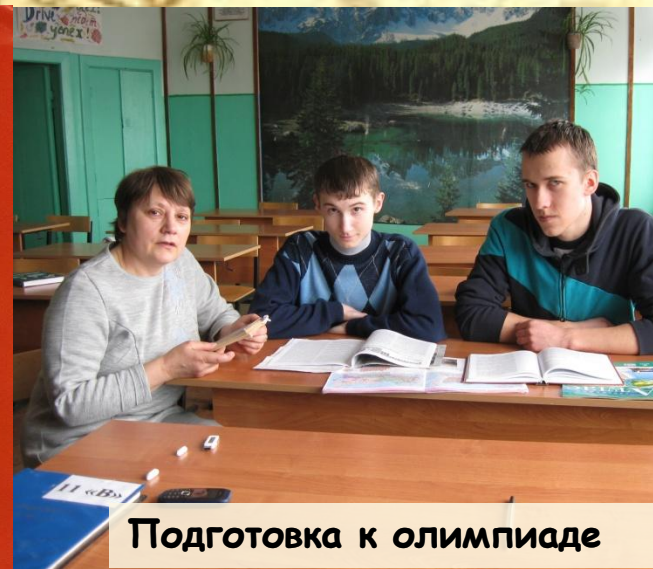
Подготовка к олимпиаде

ежегодные победы и участие во Всероссийской олимпиаде от муниципального до Заключительного этапов