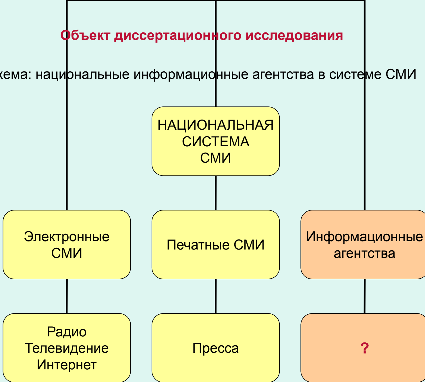
Схема: национальные информационные агентства в системе СМИ