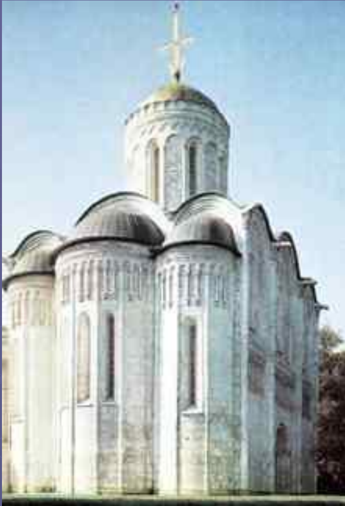
Дмитриевский собор во Владимире