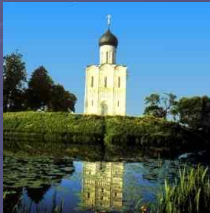
Церковь Покрова на Нерли