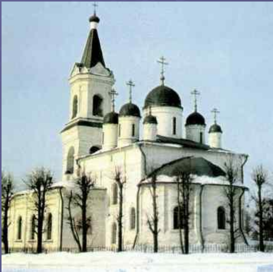
Белая Троица в Твери

На Руси строятся новые города, создаются нарядные княжеские палаты и величественные соборы