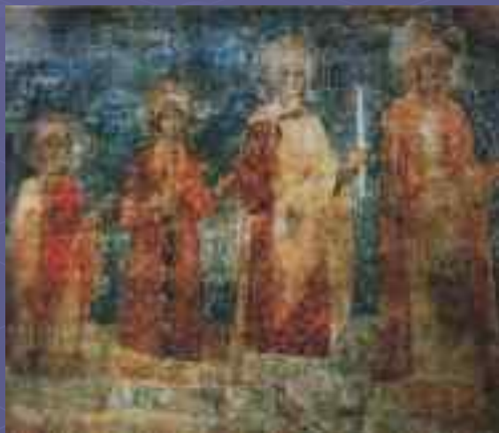
Дочери Ярослава Мудрого фреска