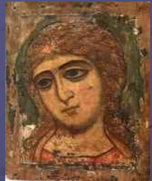
Ангел Златые Власы