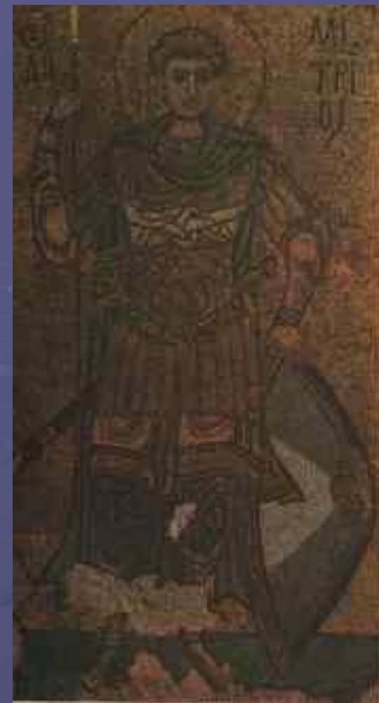
Дмитрий Солунский мозаика