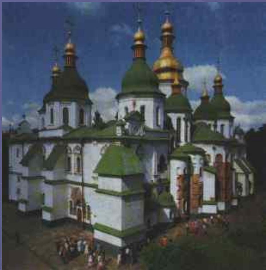
Собор Святой Софии в Киеве

Храмы Руси подчеркивают единение человека с богом, слияние с природой.