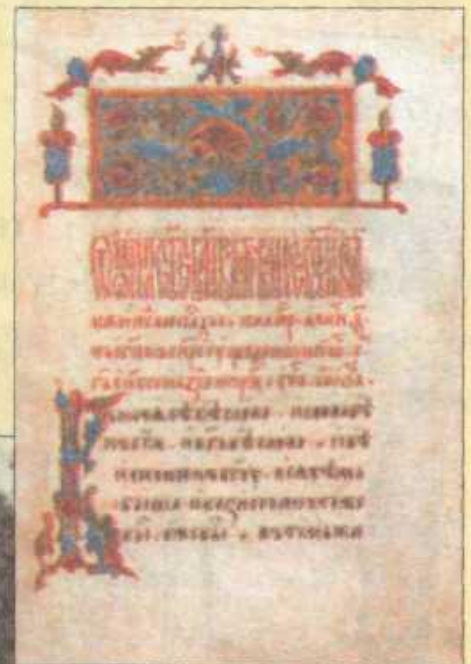
Кириллический алфавит (фрагмент).

Ѧ зъ Ѧ бѣки Ѧ вѣди Ѧ глаголь Ѧ добро Ѧ ѣсть Ѧ живѣте Ѧ сѣло Ѧ земля Ѧ иже Ѧ како Ѧ люди Ѧ мыслѣте Ѧ нашъ Ѧ онъ Ѧ покой Ѧ рцы Ѧ слово Ѧ твердо Ѧ икъ Ѧ фертъ Ѧ хѣръ Ѧ отъ Ѧ цы Ѧ червь Ѧ ша Ѧ ша Ѧ ѣръ Ѧ ѣры Ѧ ѣрь Ѧ ять Ѧ юсъ Ѧ кси Ѧ пси Ѧ днѣ Ѧ ижица Ѧ