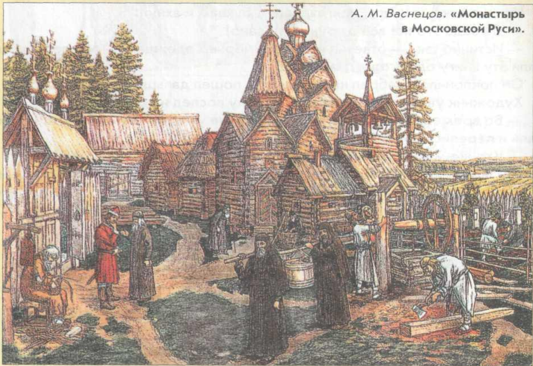
А. М. Васнецов. «Монастырь в Московской Руси».

Какую работу выполняли монахи в монастыре?