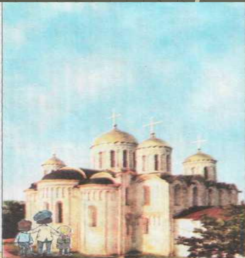
Успенский собор во Владимире.