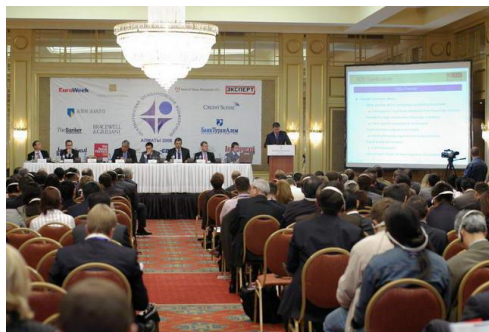
VII Алматинская межбанковская конференция