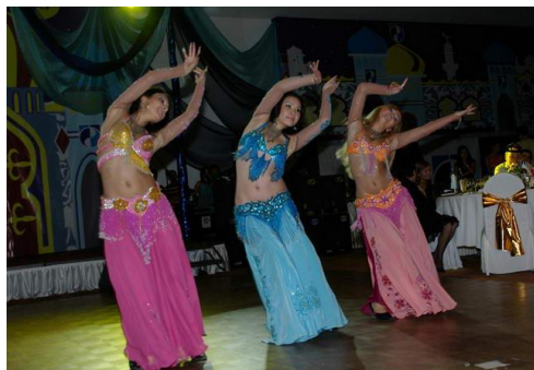
«Восточная сказка» - заключительный вечер конференции 2006 года