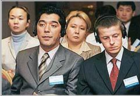
II Алматинская межбанковская конференция