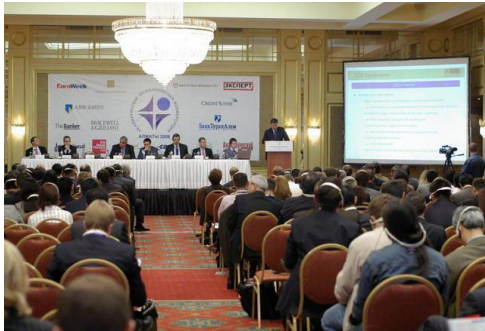
VII Алматинская межбанковская конференция