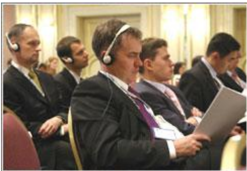
VI Алматинская межбанковская конференция