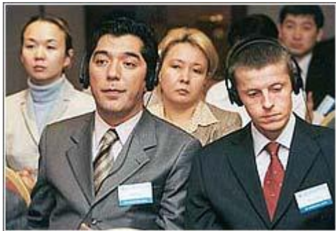
II Алматинская межбанковская конференция