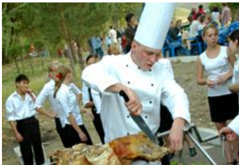
Выезд на природу