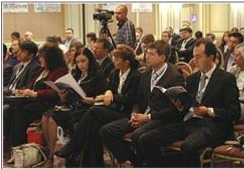
V Алматинская межбанковская конференция

Организаторы Алматинской межбанковской конференции имеют честь пригласить Ваш уважаемый банк выступить в качестве спонсора Конференции.