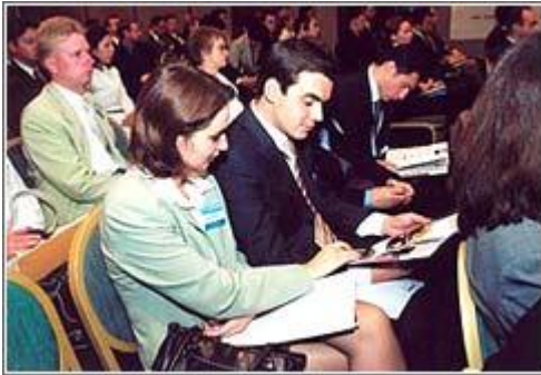
III Алматинская межбанковская конференция