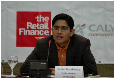
VII Алматинская межбанковская конференция