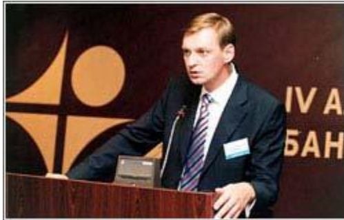
IV Алматинская межбанковская конференция

IX Алматинская межбанковская конференция – это более 500 участников с более, чем 50 стран: