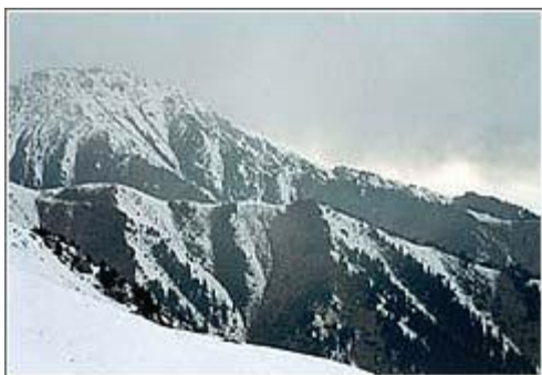
Горы Зайлийского Алатау