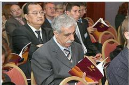
IX Алматинская межбанковская конференция

Основная тема IX Алматинской межбанковской конференции: «Мировой кризис: банковские системы СНГ – новые правила игры».