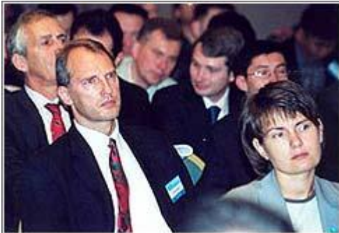
III Алматинская межбанковская конференция