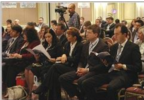
V Алматинская межбанковская конференция