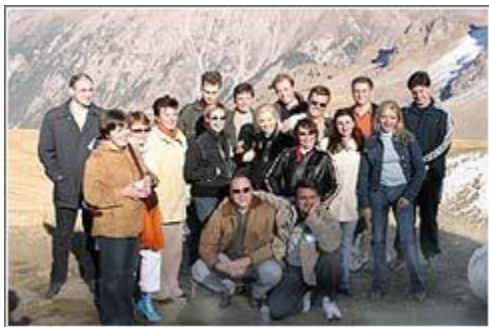
Экскурсия на Чимбулак