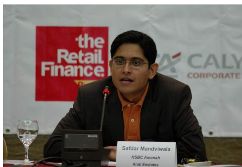
VII Алматинская межбанковская конференция