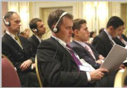
VI Алматинская межбанковская конференция