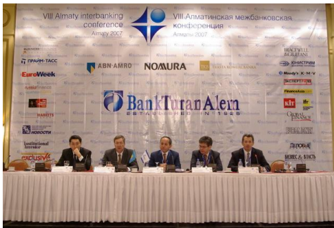
VIII Алматинская межбанковская конференция