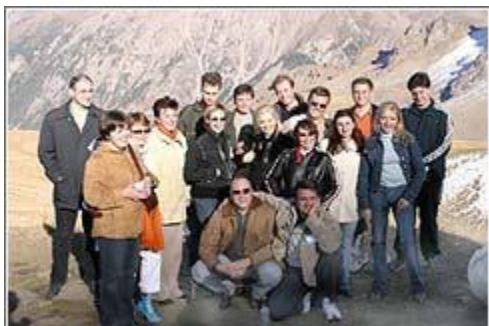
Экскурсия на Чимбулак