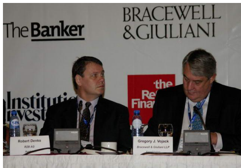
Спонсоры VI конференции