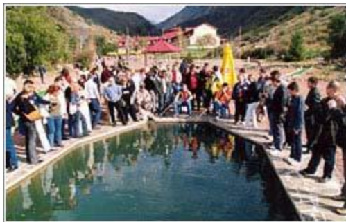
Загородный пикник на форелевых озерах (Казахстан)