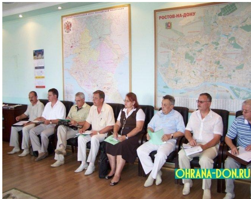
Заседание Координационного Совета при ГУВД по РО от 05.11.2009 г.