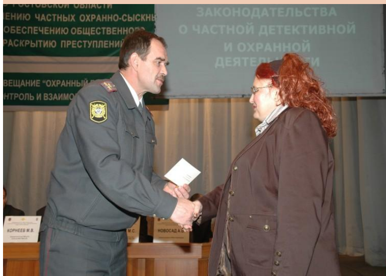
Семинар-совещание «Охранный бизнес региона. Контроль и взаимодействие» 21.02.2008 г.

Нагрудный знак «15 лет в частной охране»