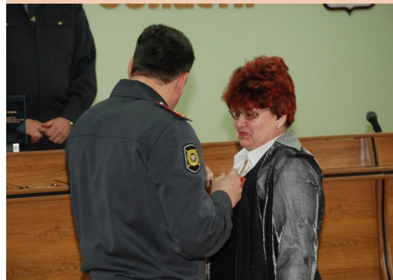
Расширенное заседание Координационного Совета при ГУВД по РО 26.02.2010 г.

Медаль «За безупречный труд. Охрана и безопасность»