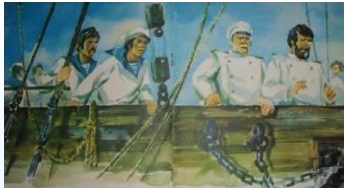
4. Выстрел / ужас