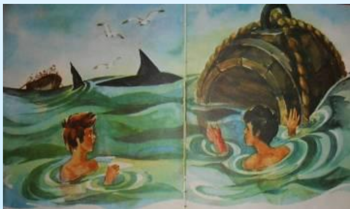
3. Акула / тревога, страх