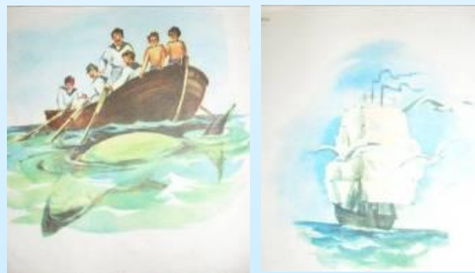
5. Дети спасены / радость и облегчение