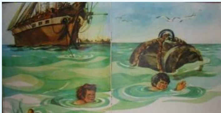
2. Мальчики в открытом море / волнение