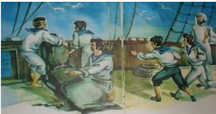
1. Купальня в парусе / спокойствие