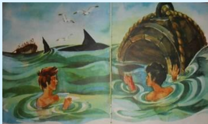
3. Акула / тревога, страх