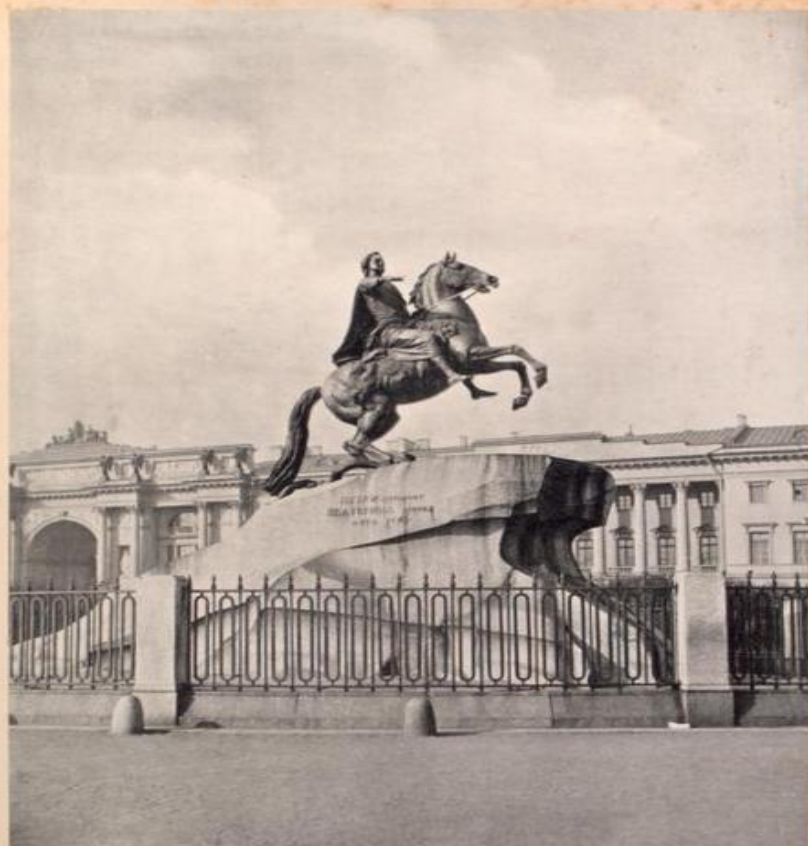
Monument de Pierre le Grand.