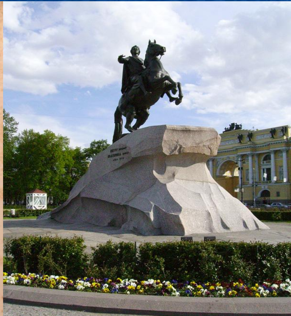
Monument Peter des Grossen.