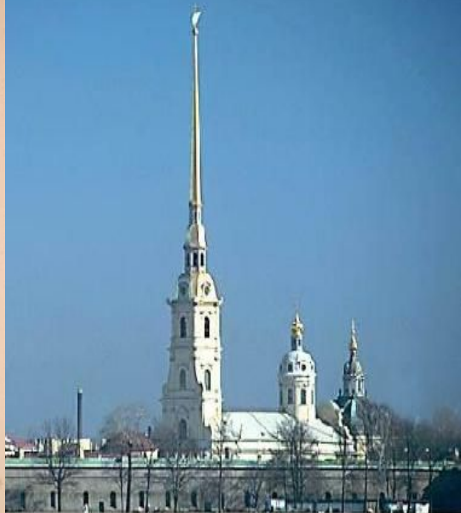
Die Petri und Pauli Festung.