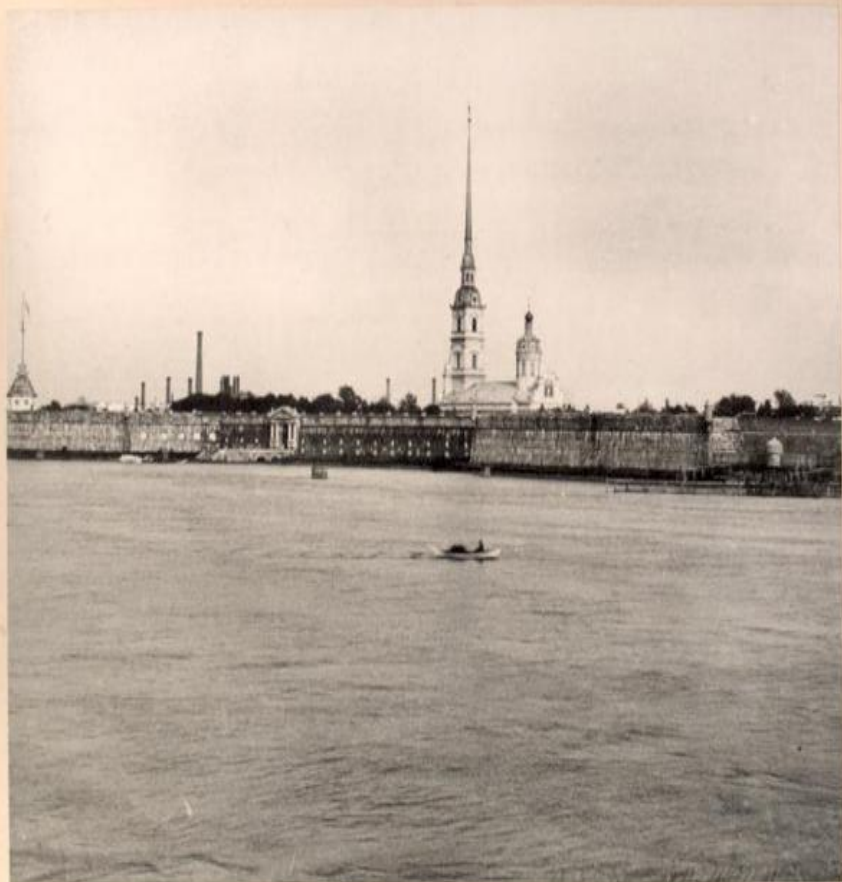
La forteresse de St. Pierre et de St. Paul