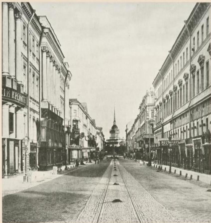
Perspective de Novsky.