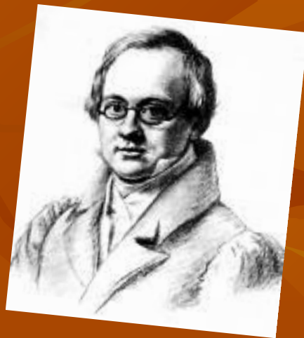
А.П. Дельвиг В.П. Лангер. 1830г