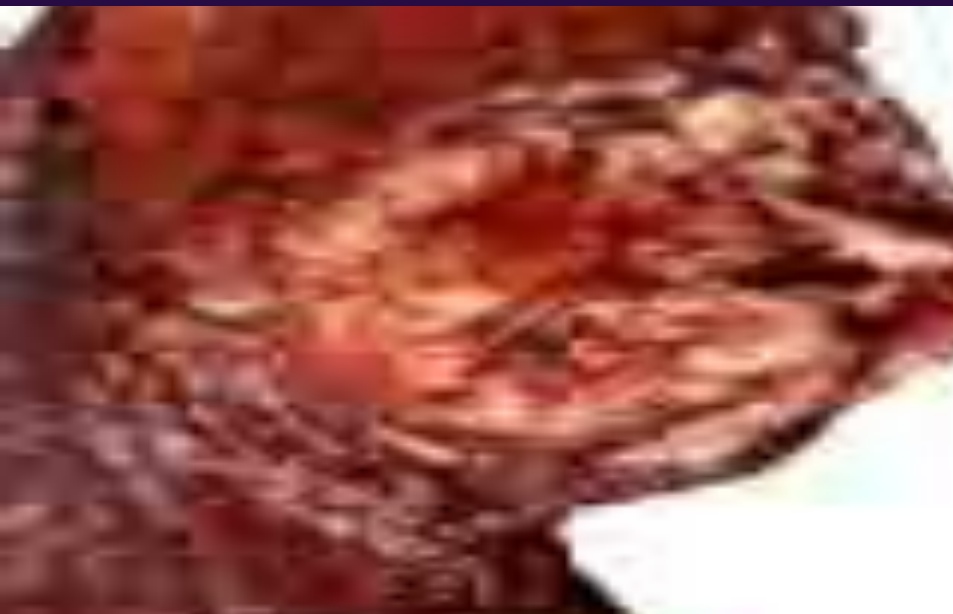
Легкие после 5 лет курения