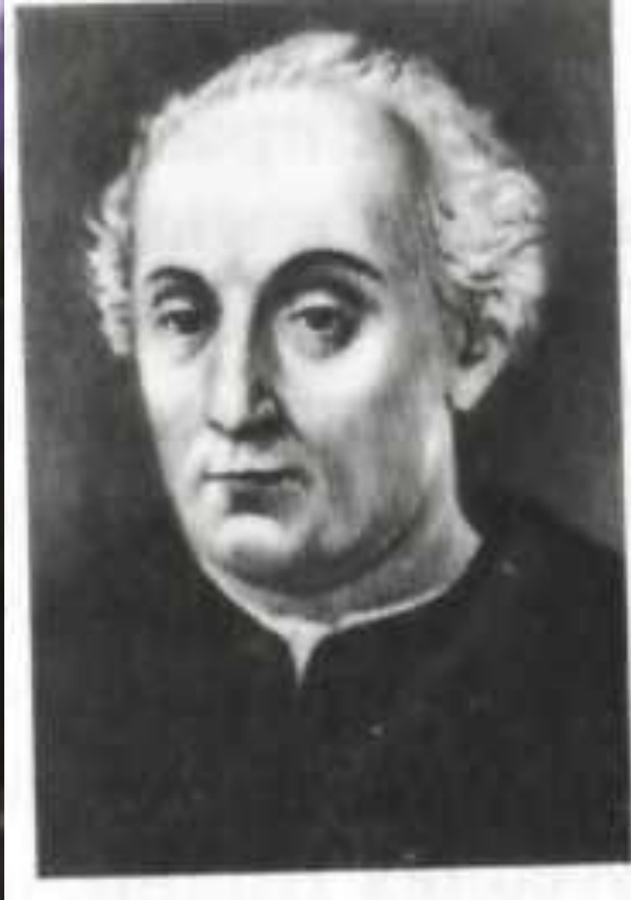
Христофор Колумб (1451-1506)