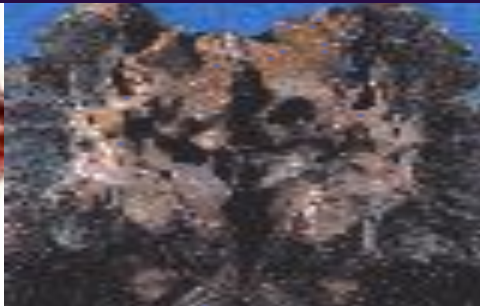
Легкие после 25 лет курения