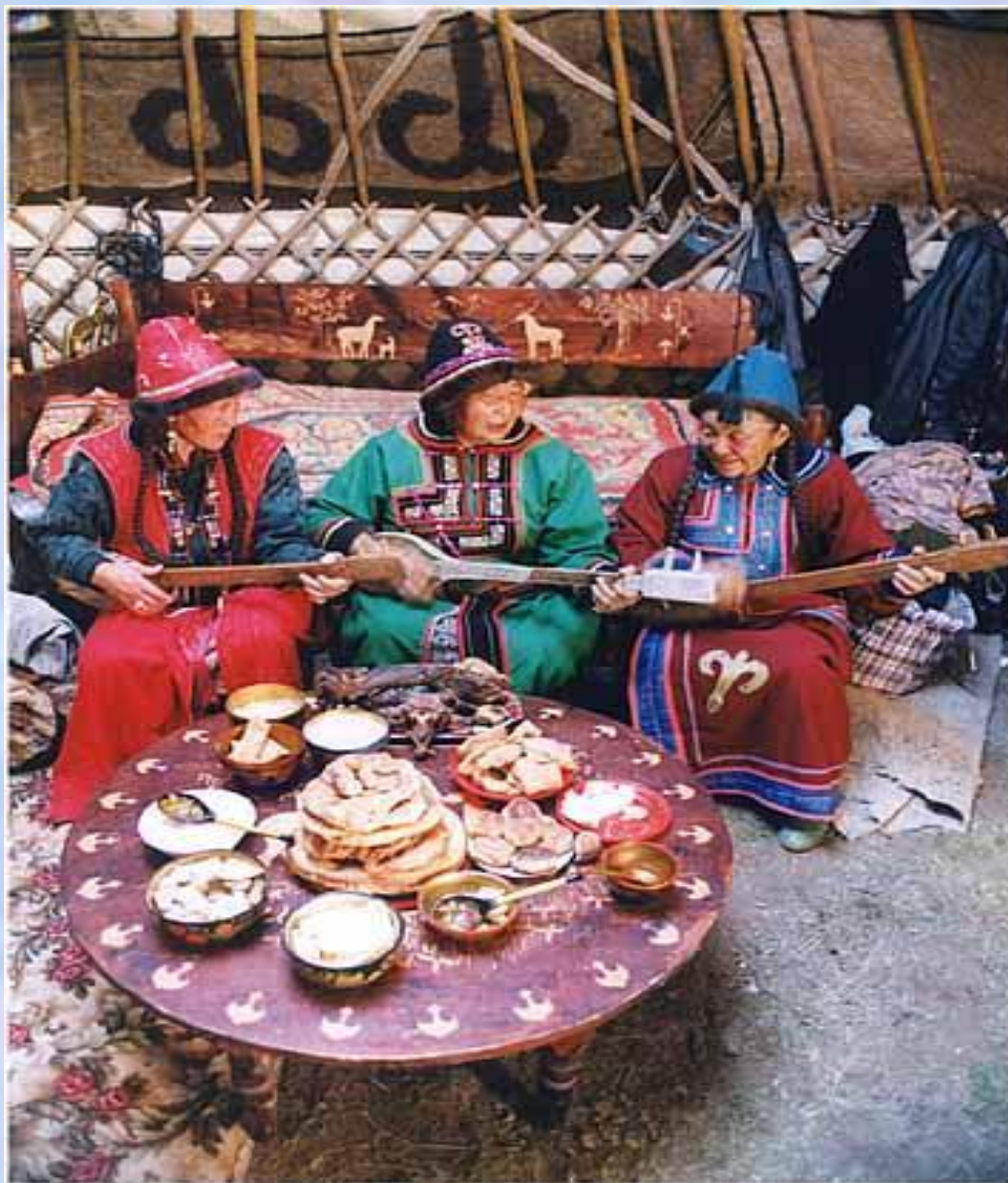
Национальная кухня алтайцев