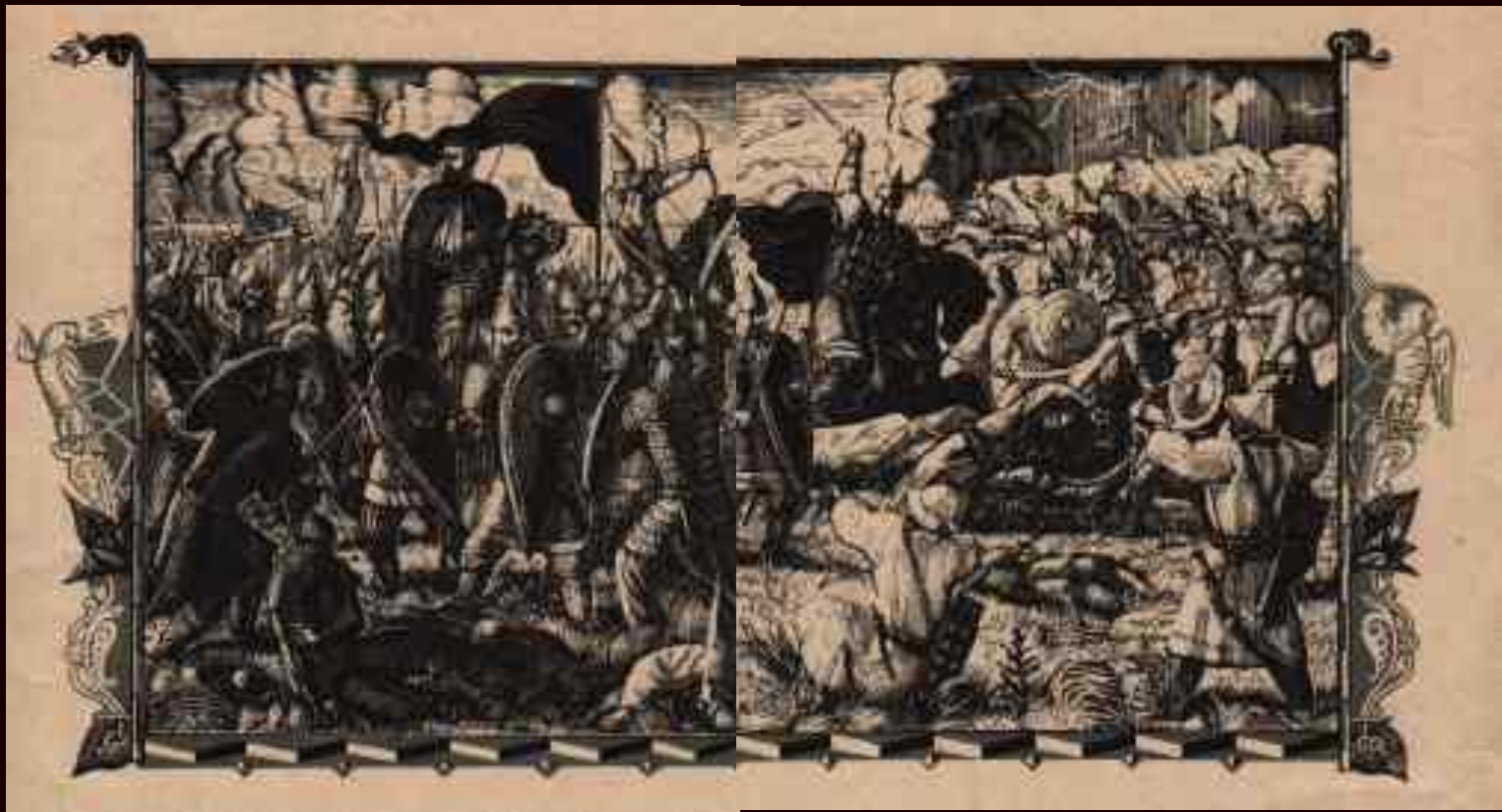
Бой с половцами. Иллюстрация Фаворского.

Бились день, бились другой, на третий день к полудня пали стяги Игоревы.