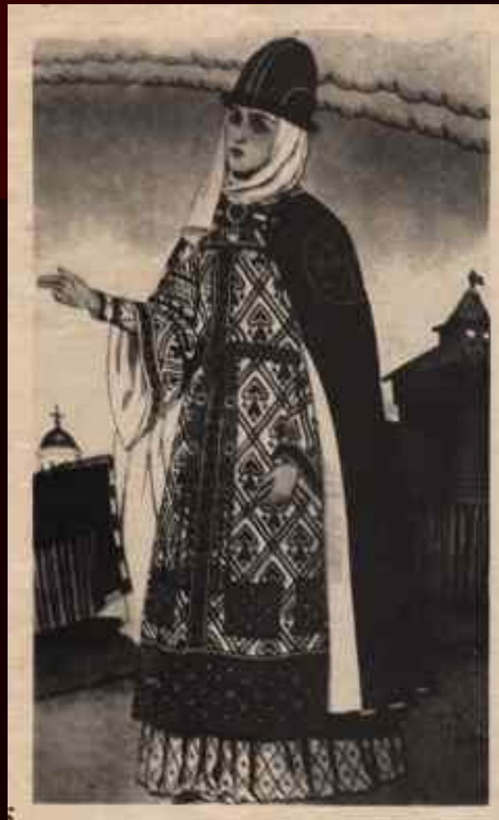
Ярославна Худ. И.Я.Билибин