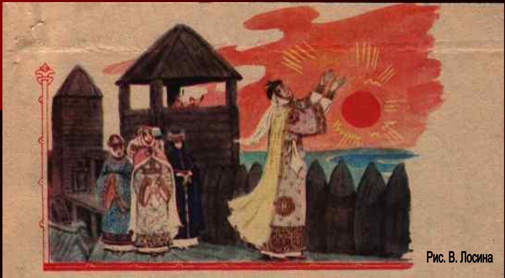
Рис. В. Лосина

Светлое и пресветлое Солнце! Для всех тепло и красно ты!