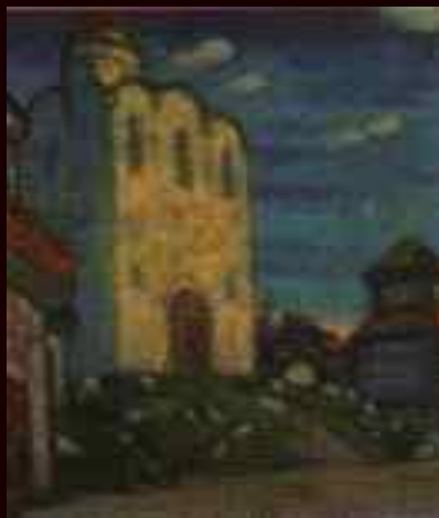
Путивль Иллюстрация Рериха

О Днепр Словутич! Ты пробил каменные горы, проходя сквозь землю Половецкую, ты лелеял на себе Святославовы ладьи до полка Кобякова – прилелей, господин, моего милого ко мне, чтоб не слала к нему слез на море рано!