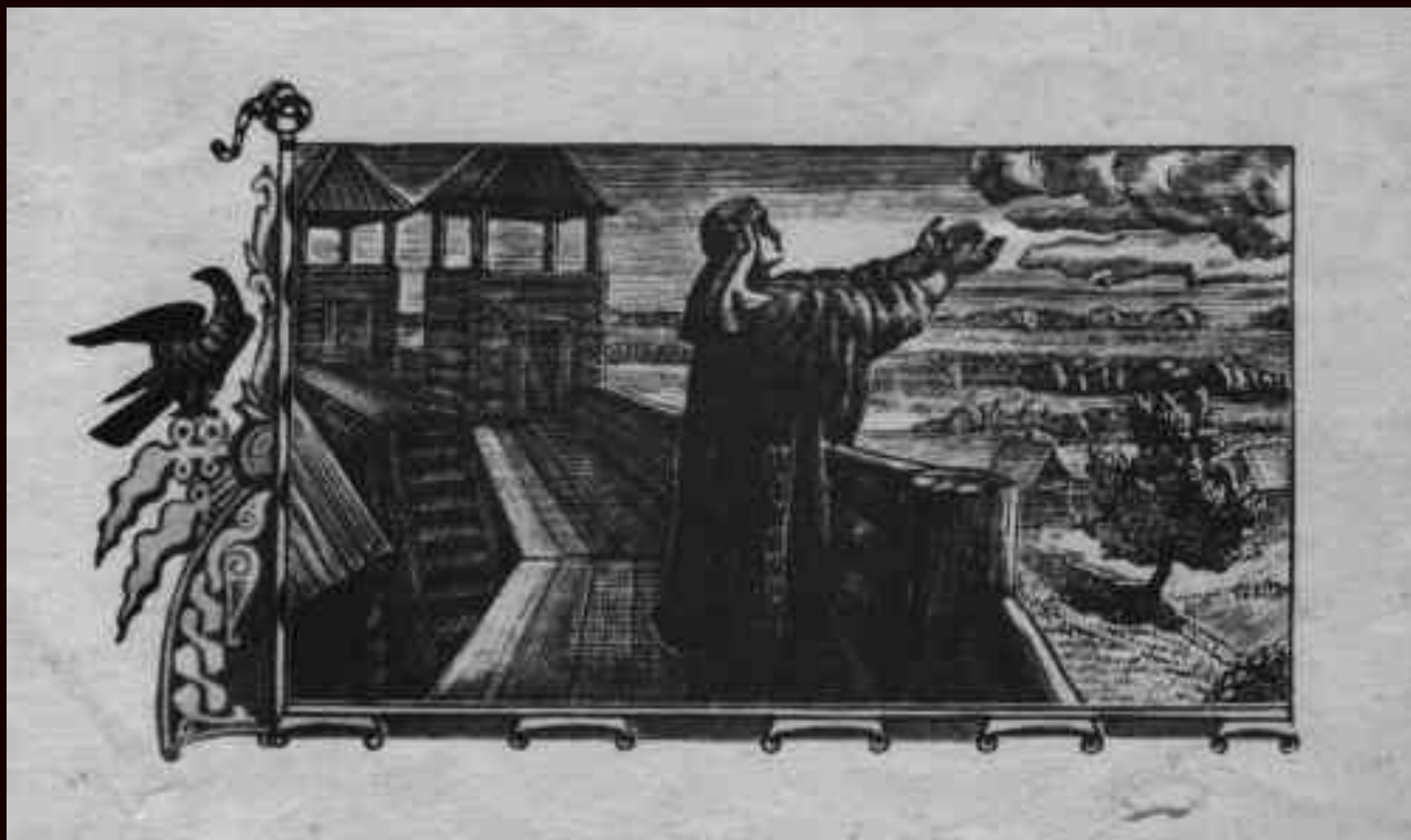
Плачь Ярославны Гравюра В.А.Фаворского

О Ветер-Ветрило! Зачем, господин, навстречу веешь? Зачем наносишь стрелы хиновцев на своих легких крыльях на воинов моего лады? Зачем, господин, мое веселие по степи ковыльной развеял?