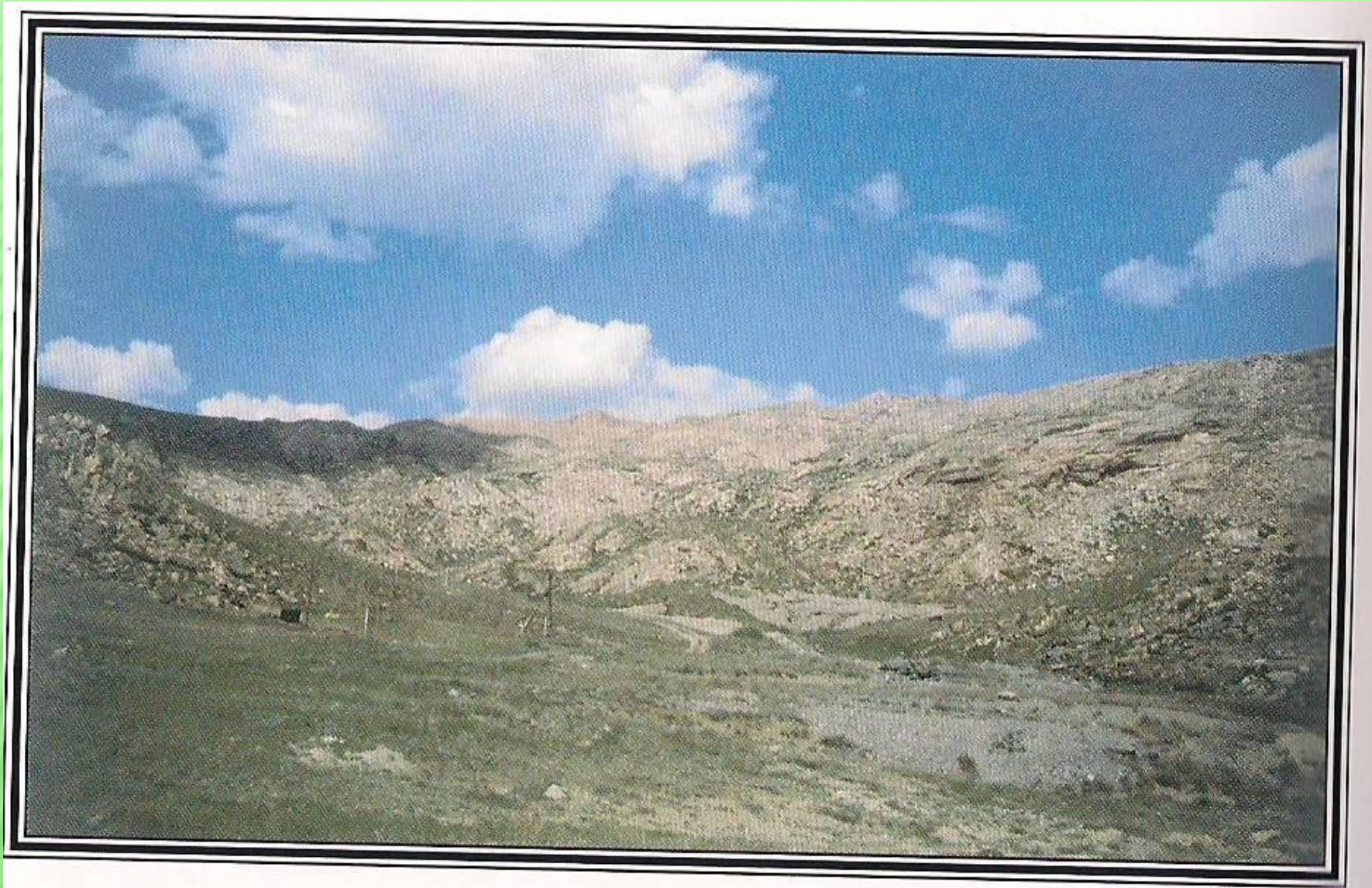
Дегелен: гора, изрытая штольнями.