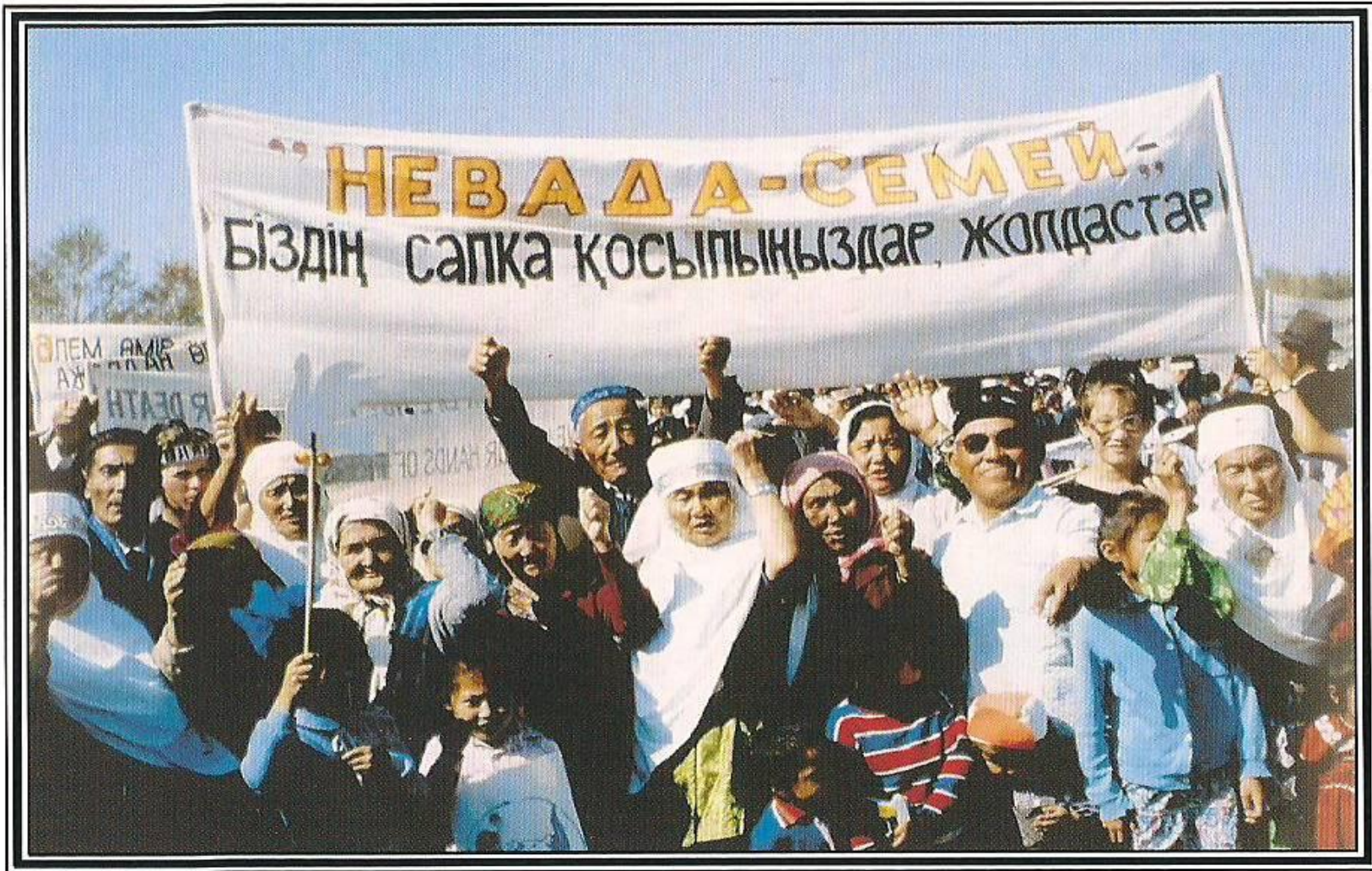
Митинг антиядерного движения «Невада-Семей». 1991 год.