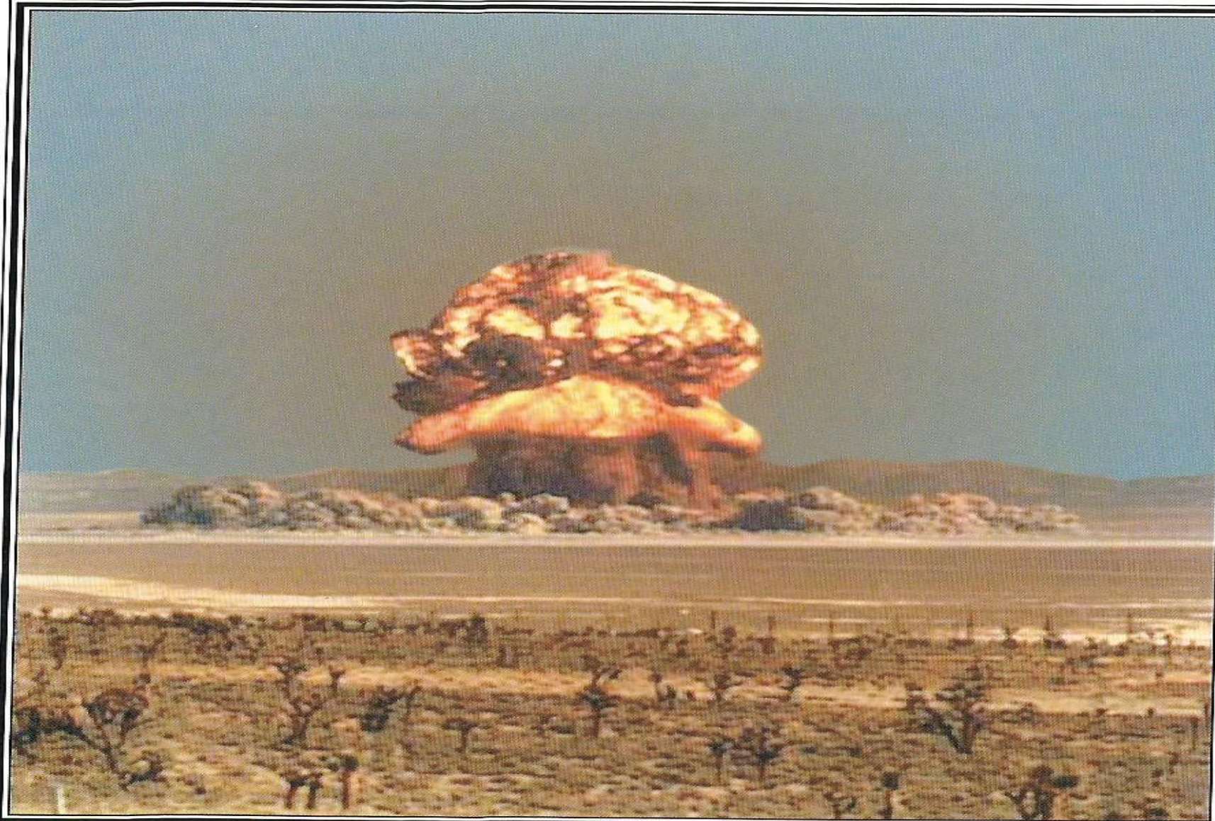
Мощность взрыва: 11 Кт. Дата испытаний 14.09.1957 г.