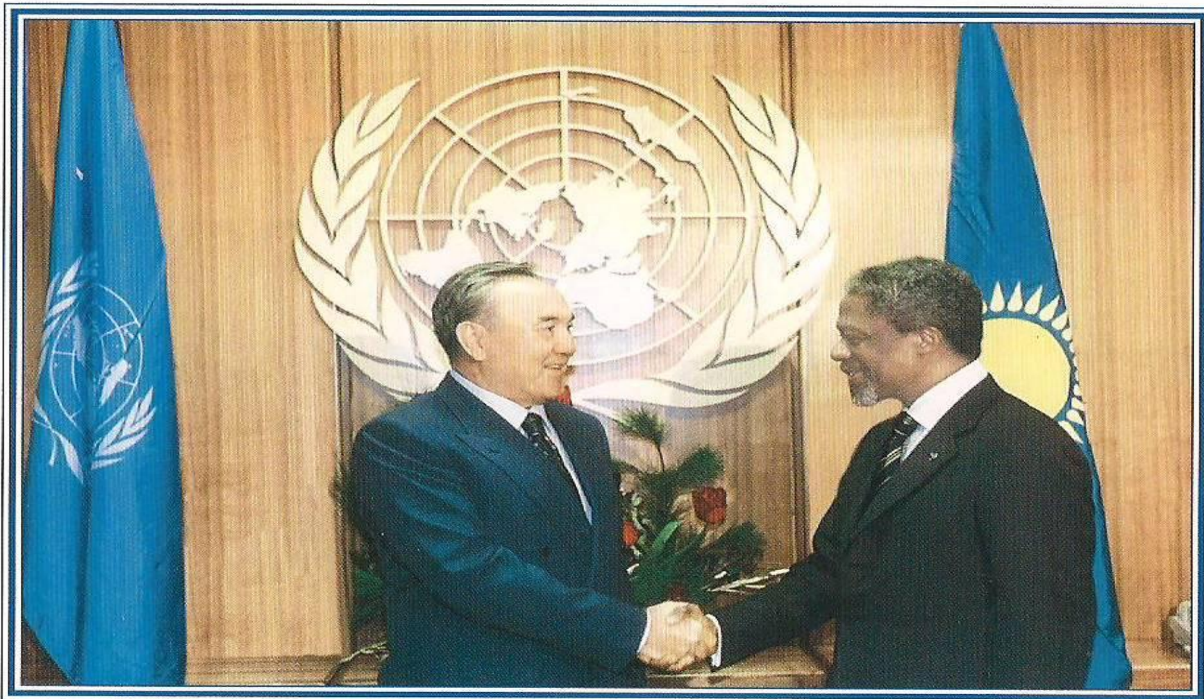
С Генеральным Секретарем ООН К. Аннаном. Нью-Йорк, декабрь 1999 года.