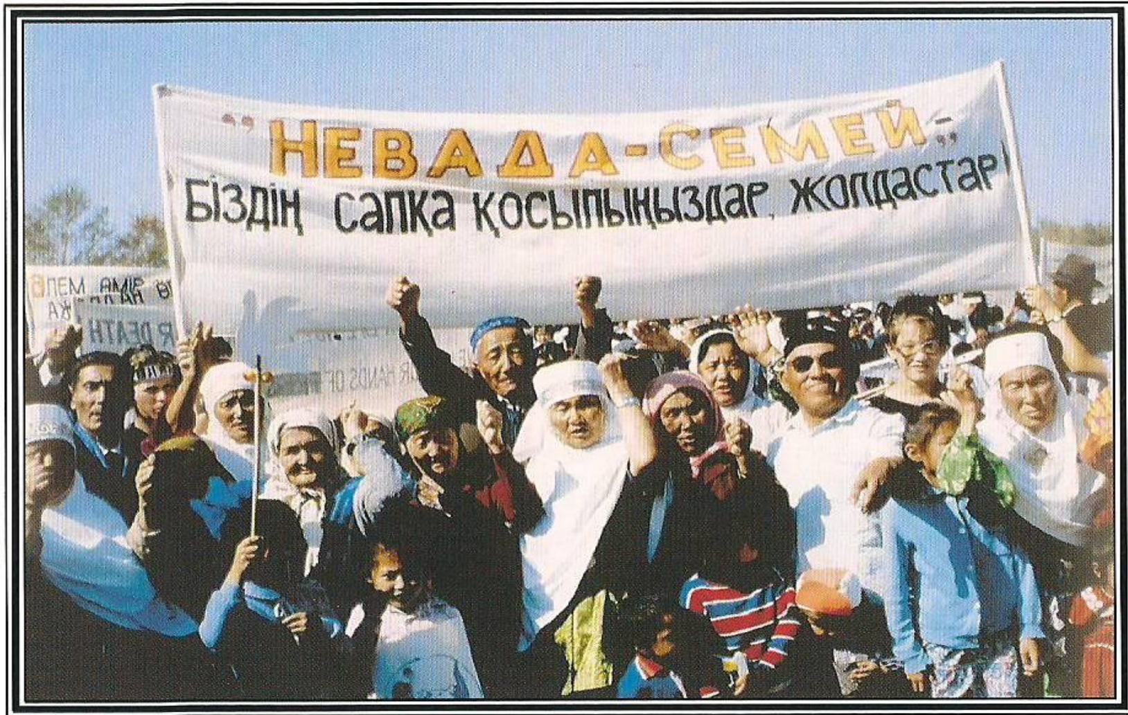
Митинг антиядерного движения «Невада-Семей». 1991 год.