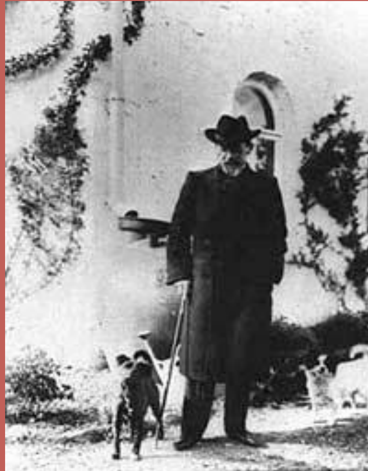
А.П. Чехов. Ялта. 1903 г.

( отражение реальности, жизненной правды)