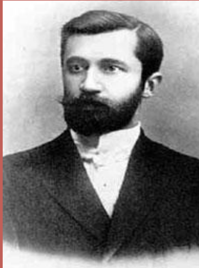
• Дмитрий Сергеевич Мережковский