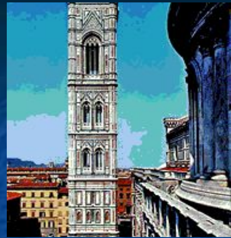
Кампанила собора Санта-Мария дель Фьоре во Флоренции. Построена в 1334-1359 гг.

БОТТИЧЕЛЛИ (Botticelli) Сандро (наст. Алессандро Филлипепи, Filiperi) (1445-1510), итальянский живописец. Представитель Раннего Возрождения. Был близок ко двору Медичи и гуманистическим кругам Флоренции.