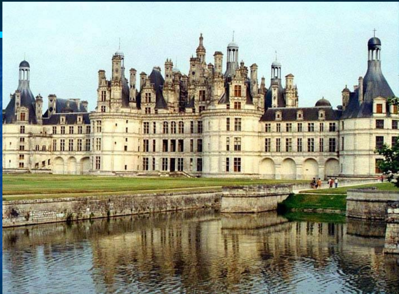
Замок Шамбор. 1519-1559. Франция.