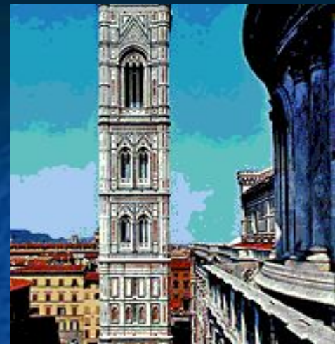
Кампанила собора Санта-Мария дель Фьоре во Флоренции. Построена в 1334-1359 гг.

БОТТИЧЕЛЛИ (Botticelli) Сандро (наст. Алессандро Филипепи, Filiperi) (1445-1510), итальянский живописец. Представитель Раннего Возрождения. Был близок ко двору Медичи и гуманистическим кругам Флоренции.