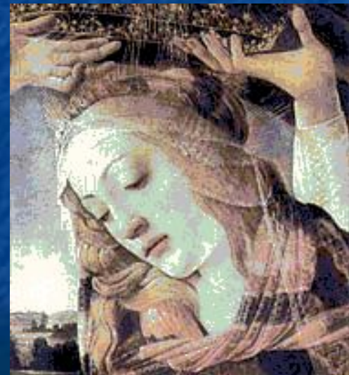
Сандро Боттичелли. Голова Мадонны. Фрагмент.