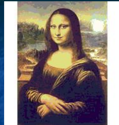
Леонардо да Винчи. «Мона Лиза».

РАФАЭЛЬ САНТИ (Raffaello Santi) (1483-1520), итальянский живописец и архитектор. Представитель Высокого Возрождения.