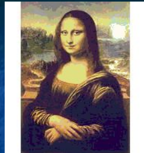
Леонардо да Винчи. «Мона Лиза».

РАФАЭЛЬ САНТИ (Raffaello Santi) (1483-1520), итальянский живописец и архитектор. Представитель Высокого Возрождения.