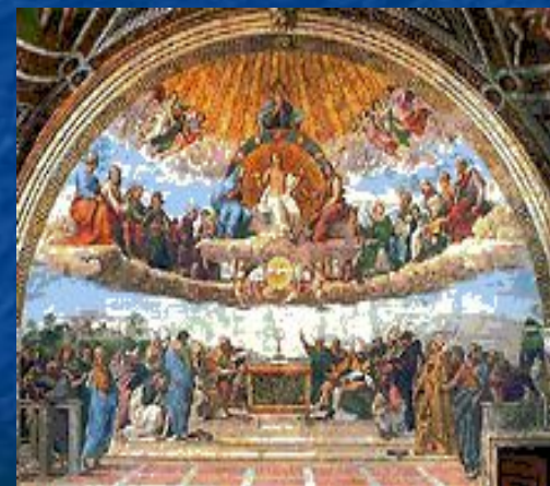
Рафаэль Санти. «Диспута». Ватикан. Рим.