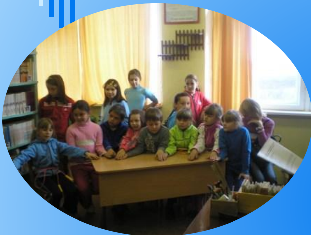
Встреча с новыми книжками