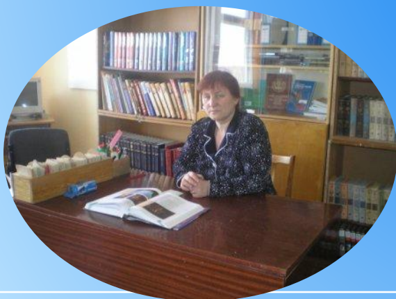
Рабочее место зав. библиотекой