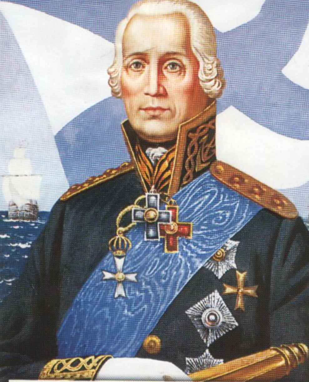
Ушаков Ф. Ф. (1744—1817) — адмирал российского флота

Адмирал Российского флота, воин по натуре, защитник Отечества - Фёдор Фёдорович Ушаков не проиграл ни одного сражения. Он -