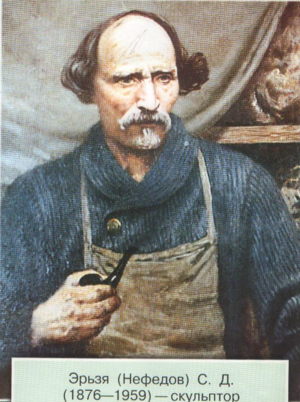
Эрзя (Нефедов) С. Д. (1876—1959) — скульптор

Своим неповторимым творчеством самобытный художник из ардатовского села Баево Степан Нефёдов навечно восславил родной народ, взяв в качестве псевдонима