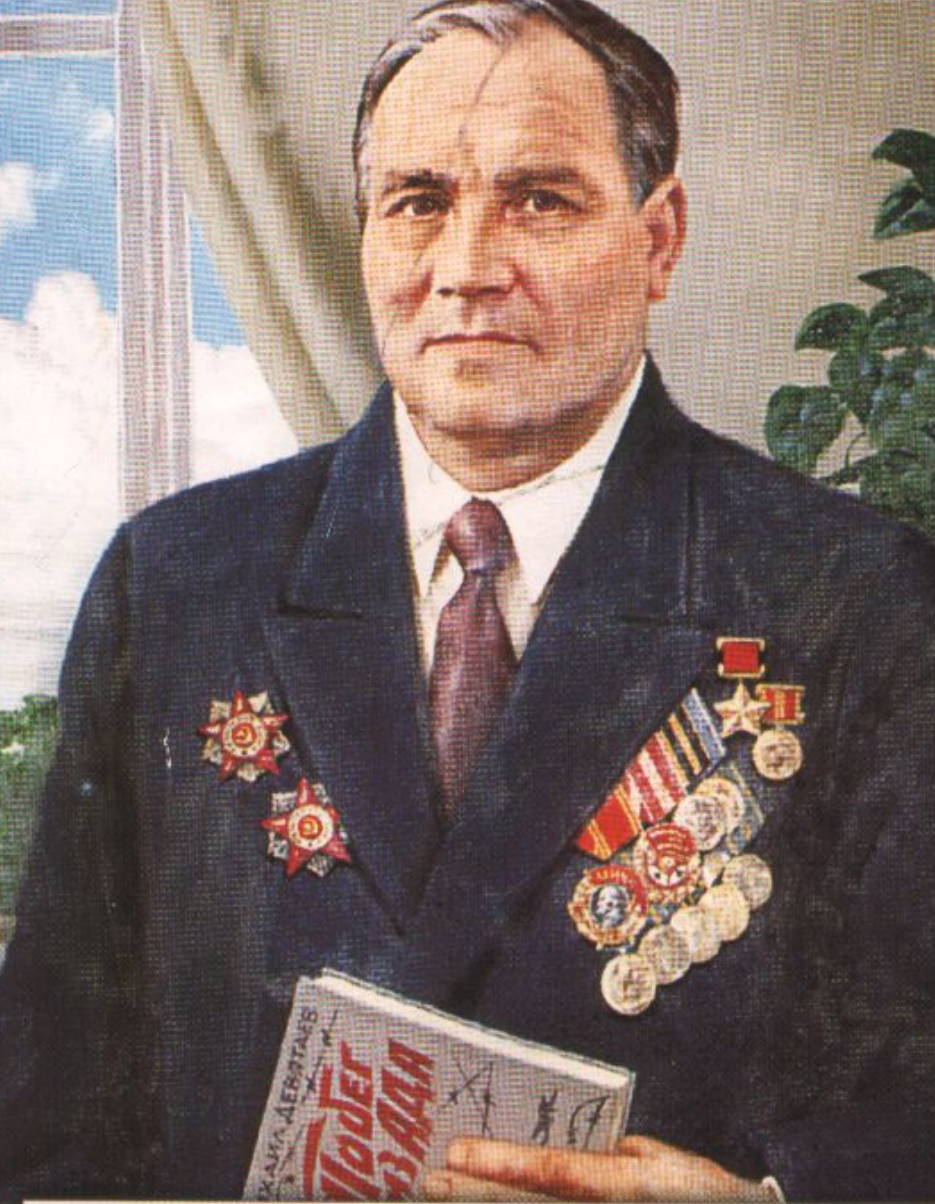
Девятаев М. П. (1917—2002) — Герой Советского Союза, летчик

Михаил Петрович Девятаев – уроженец Торбеевского района . Во время Великой Отечествен ной войны, во главе группы военнопленных, захватив