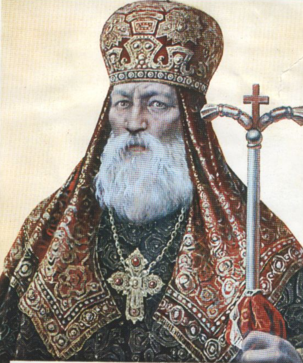
Никон (1605—1681) — патриарх Московский и всея Руси

В памяти людовой патриарх Московский и всея Руси Никон остаётся великим реформаторо