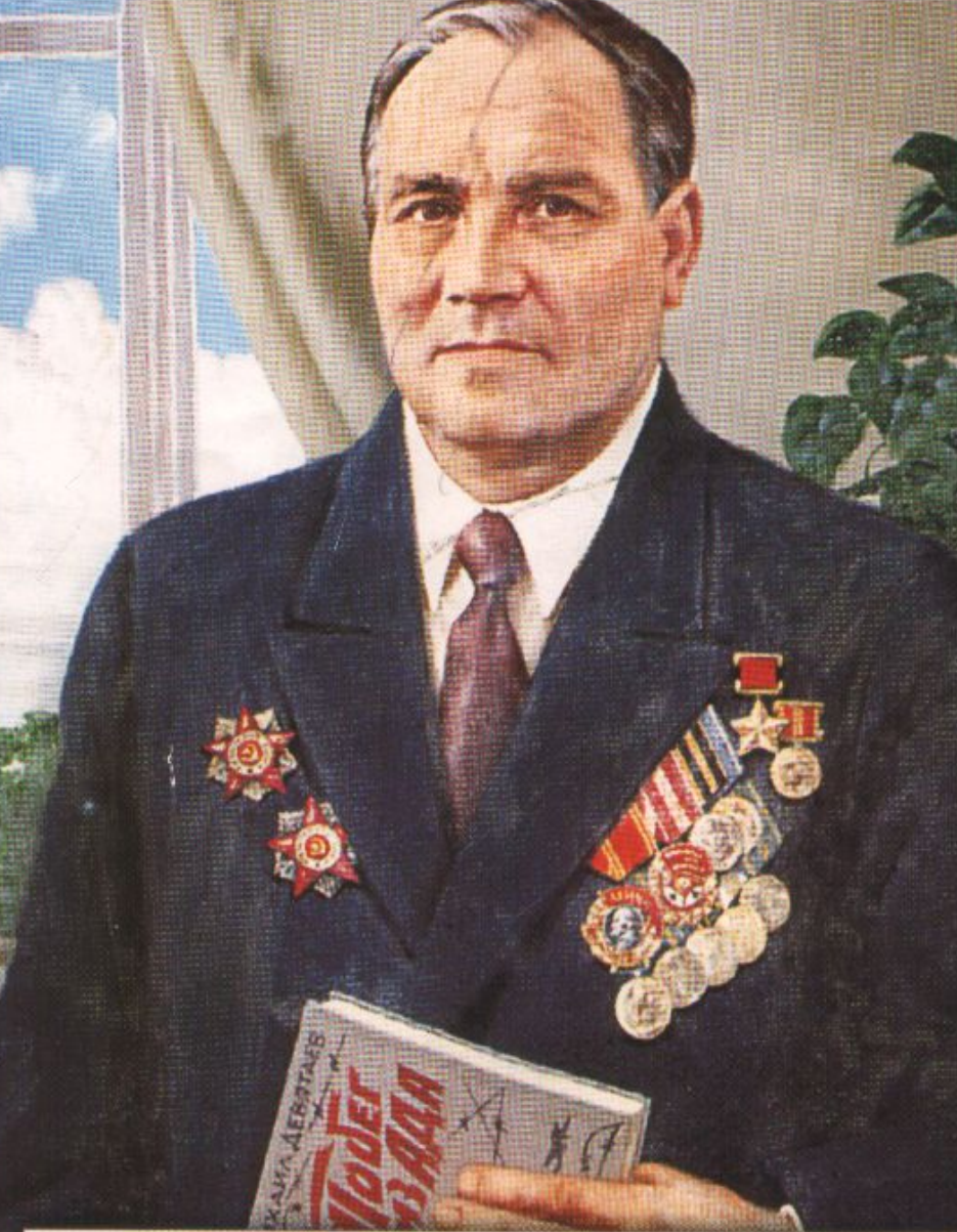
Девятаев М. П. (1917—2002) — Герой Советского Союза, летчик

Михаил Петрович Девятаев – уроженец Торбеевского района . Во время Великой Отечествен ной войны, во главе группы военнопленных, захватив