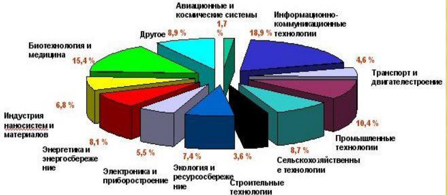
Распределение инновационных проектов и идей по отраслям