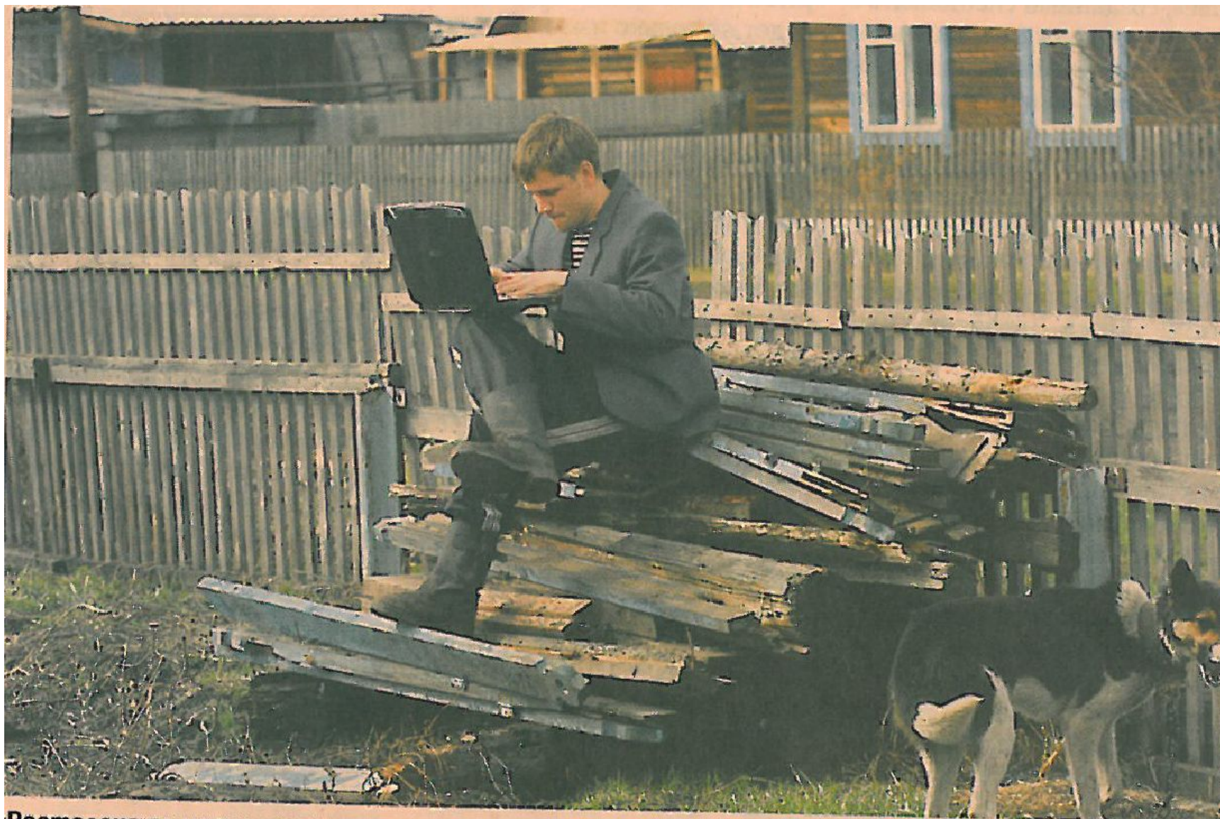
«Ведомости» от 12.11.2010