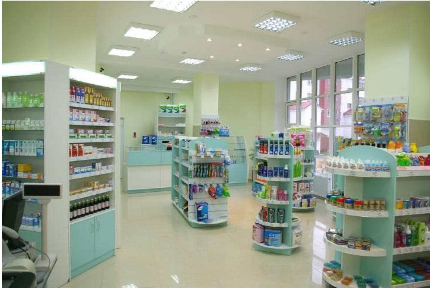
Аптека "Здоровье", г. Салехард

ТМ «Доктор Мебелис» - специализированное торговое оборудование для аптек и оптик http://www.dr-mebelis.ru/