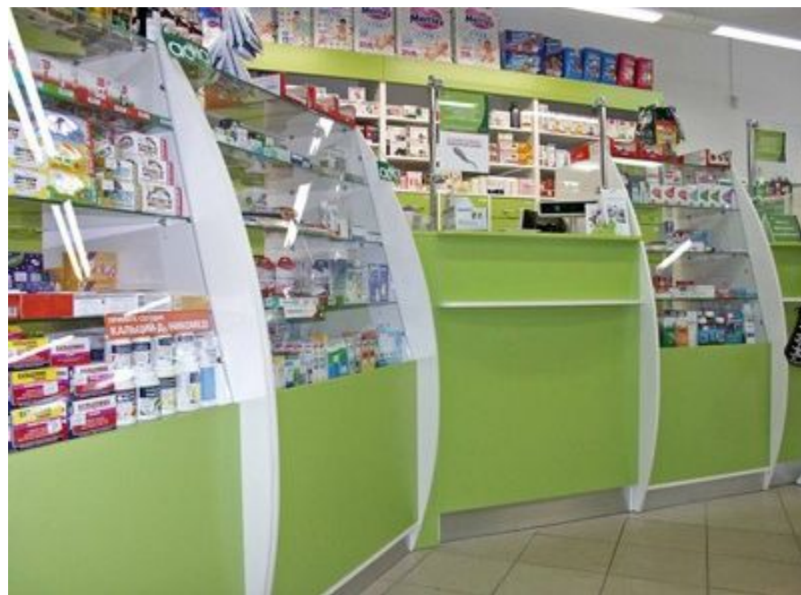
Витрины внешние укороченные