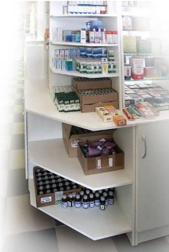
Элемент угловой внутренний