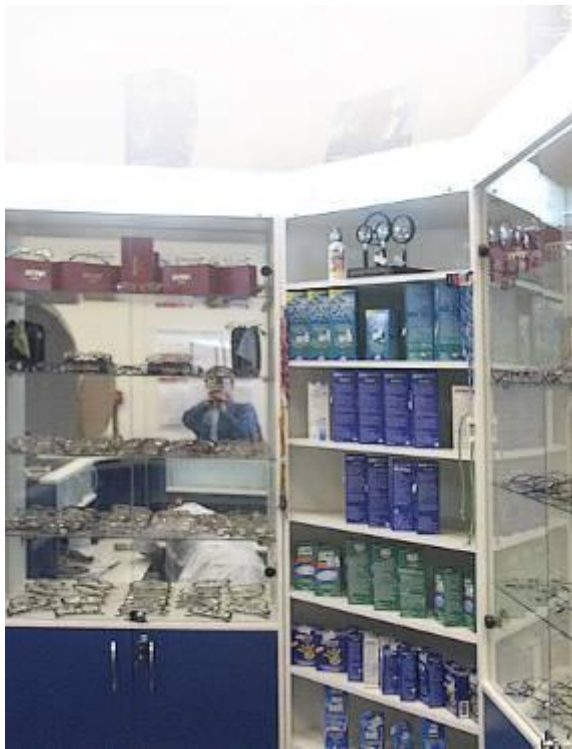
Стеллажи и витрины пристенные