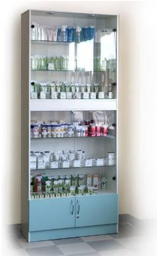
Витрина пристенная запирающаяся с накопителем