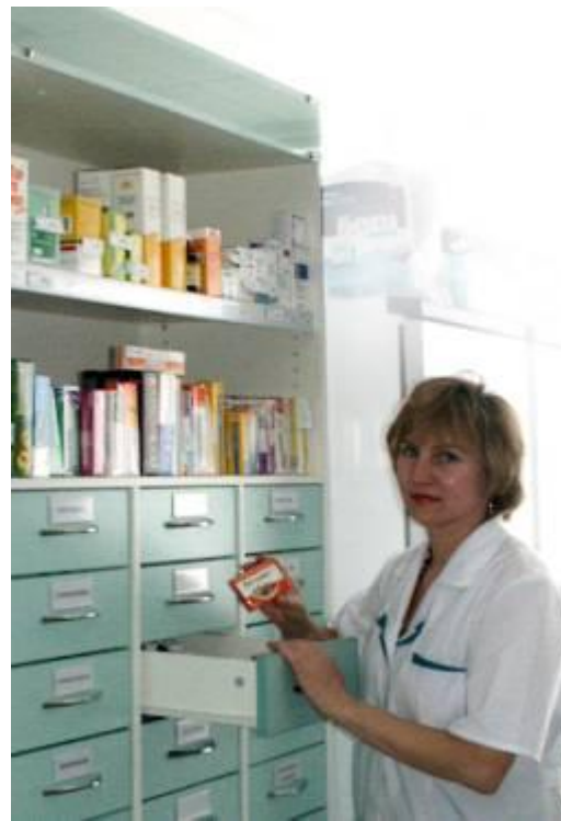
Стеллаж с ящиками