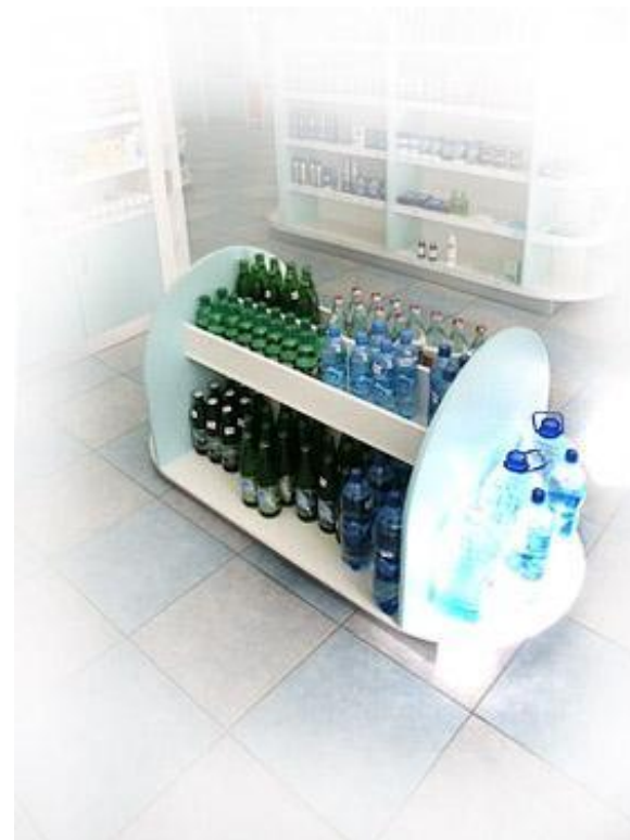
Подиум для минеральной воды