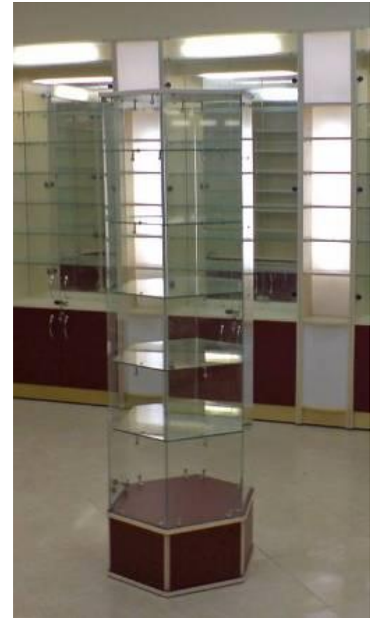
Стеллаж поворотный со стеклянными дверками