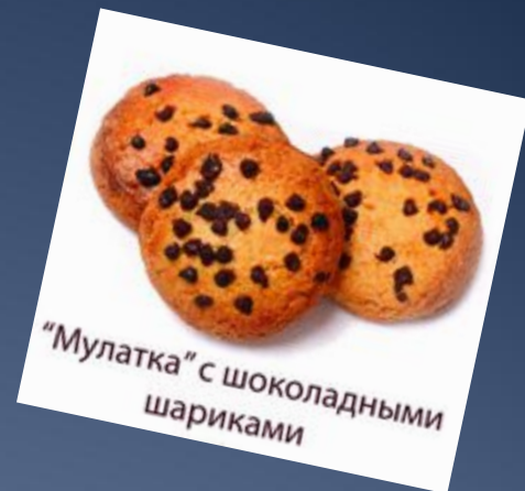
“Мулатка” с шоколадными шариками