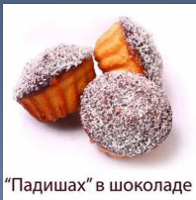
“Падишах” в шоколаде