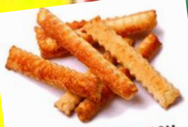
«Хворост» с сахаром или сырнй