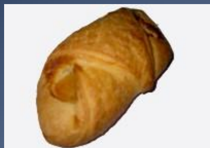
Слойка с курагой