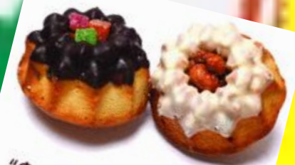
«Фонарик» с орехами или с цукатами