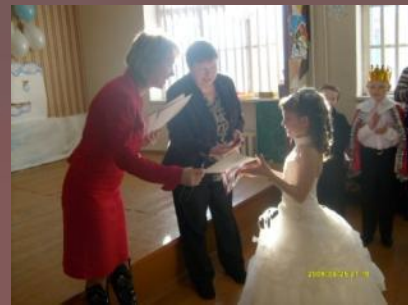
Реализация программы «Одарённые дети»