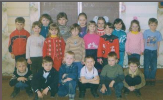
Реализация программы дошкольного образования «Ступенька»