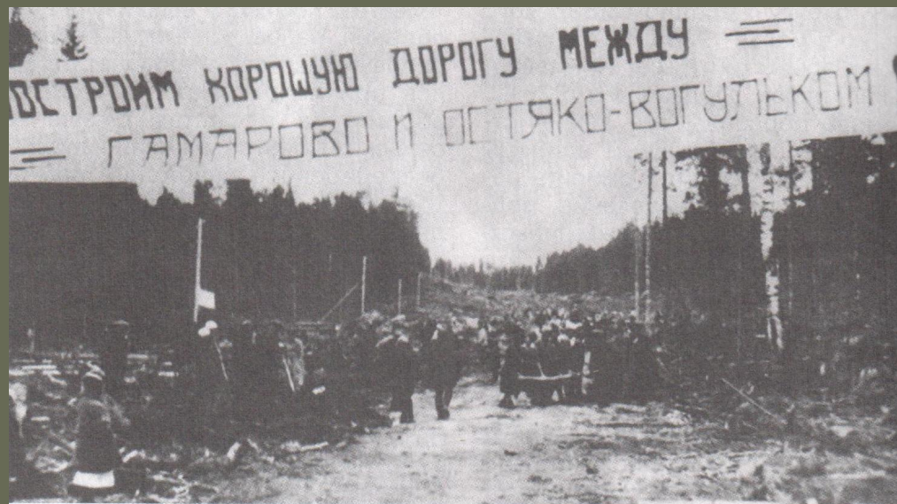
Строительство дороги между Остяко-Вогульском и Самаровым. 1932 г.

Президиум ВЦИК принял постановление «Об организации национальных объединений в районах расселения малых народностей Севера». В соответствии с ним был образован Остяко-Вогульский национальный округ с центром в селе Самарове.