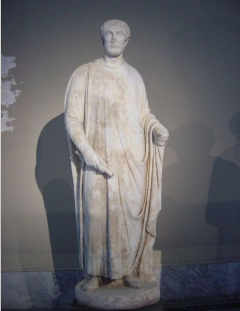
РИМСКИЙ СУДЬЯ. V В. ДО Н. Э.