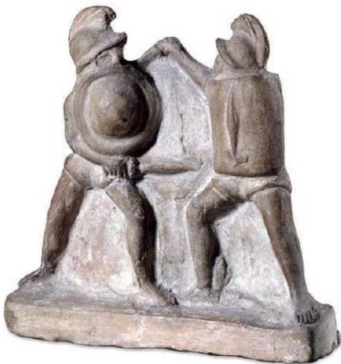
Бой гладиаторов III в. до н.э. терракотовая статуэтка

Художники и скульпторы прославляли гладиаторов, изображая их в своих работах