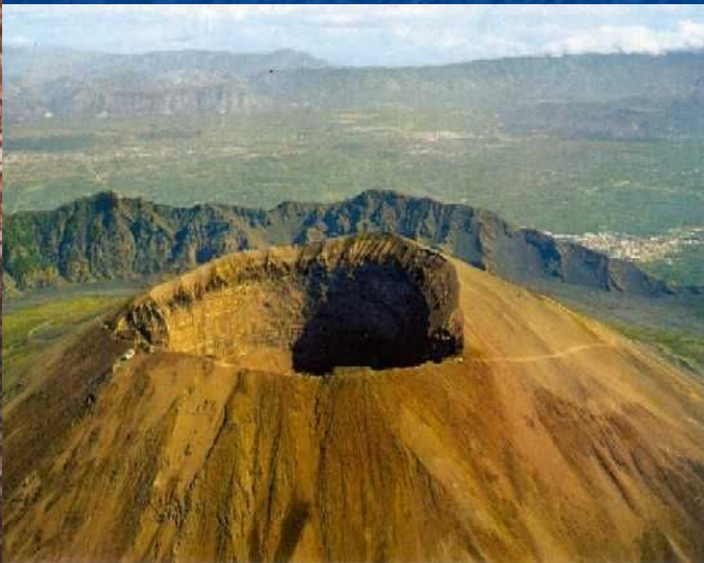
Кратер вулкана Везувий

Бесчеловечные условия содержания рабов и гладиаторов вызвали восстание под руководством Спартака.