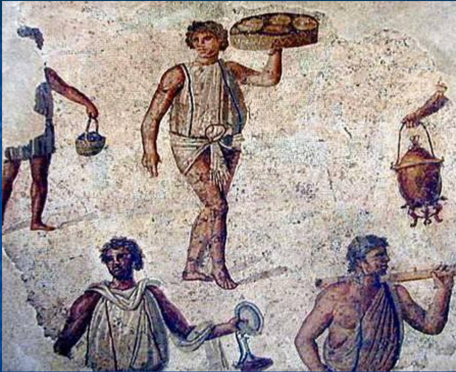
Римские рабы мозаика

Раб считался вещью своего хозяина. Его могли продать, подарить. Он был совершенно бесправен.