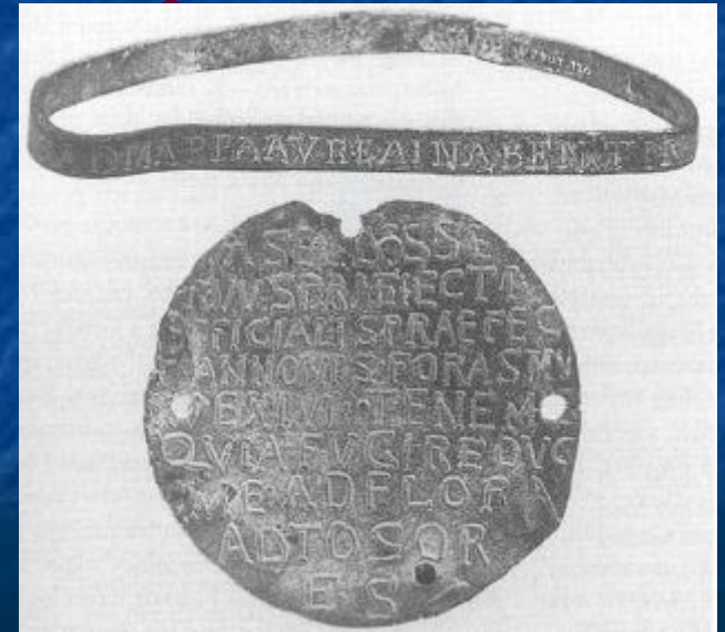
Ошейник и табличка раба

Раб считался вещью своего хозяина. Его могли продать, подарить. Он был совершенно бесправен.