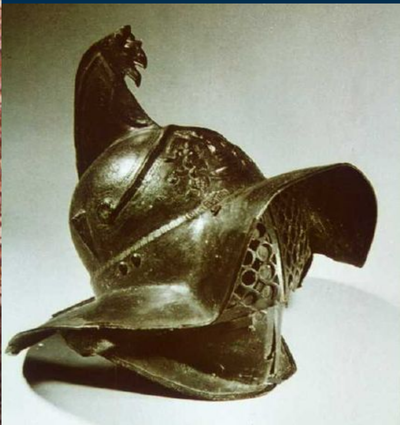
Шлем и оружие гладиаторов I век до н.э.

Вооружение гладиатора состояло из копья, меча – гладиуса, шлема, щита, наплечника (для особо храброго воина) и лат на ноги.