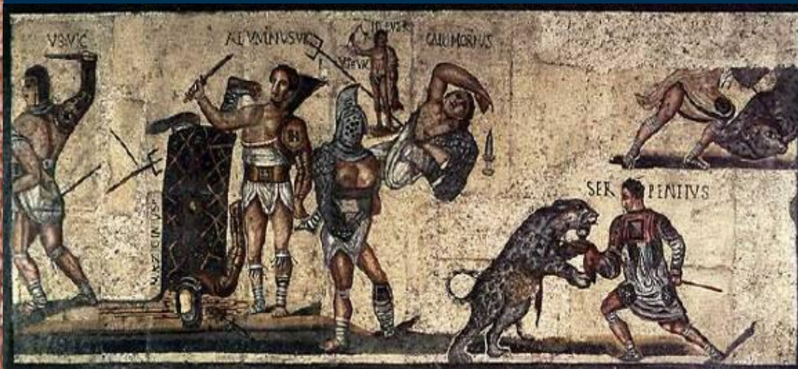
Гладиаторы римская роспись