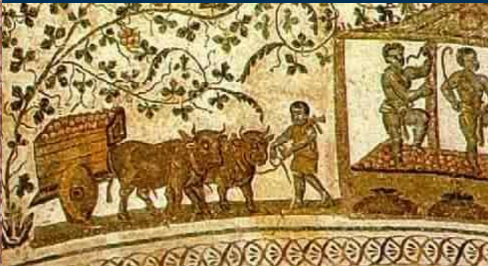
Рабы собирающие виноград. Римская мозаика