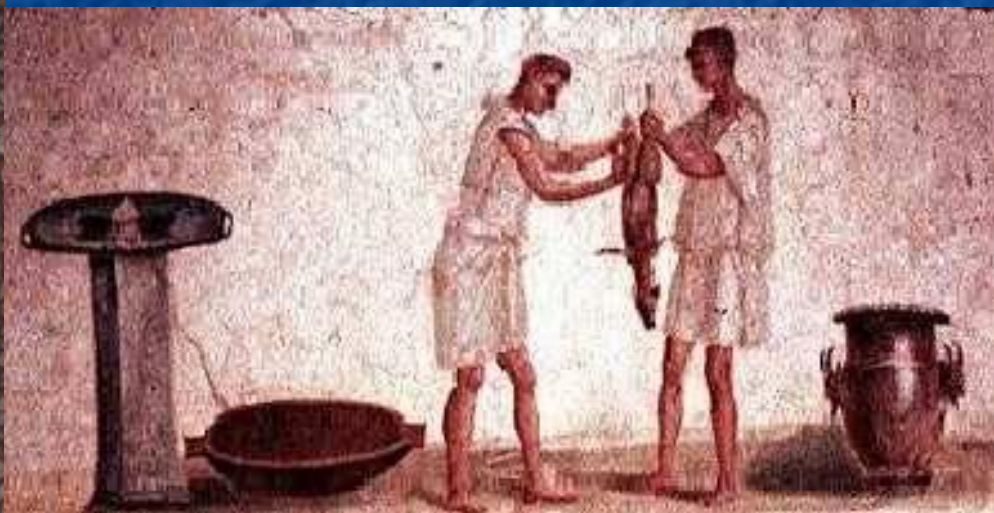
Рабы, готовящие пищу. Римская мозаика

Рабы трудились в имени хозяина: выращивали виноград, оливки, выполняли всю домашнюю работу.