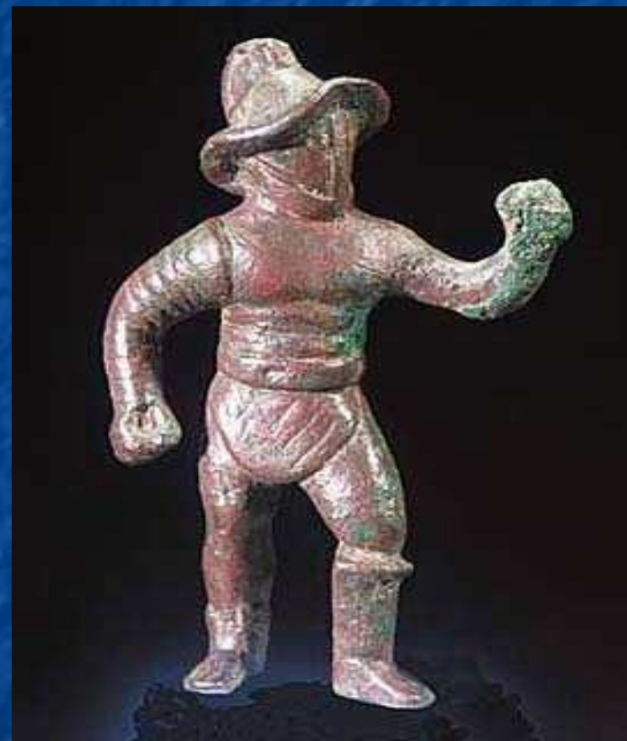
Римский гладиатор бронз. статуэтка I в. н. э.