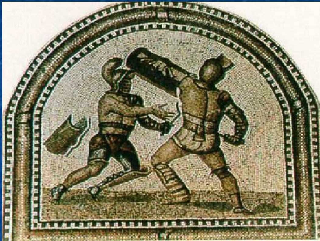
Римские гладиаторы мозаика

При поступлении в школу гладиаторы давали страшную клятву, что их можно «жечь, вязать, сечь и казнить мечом».