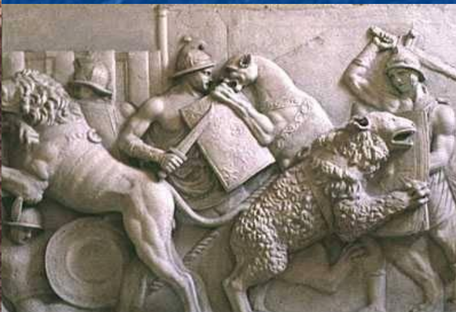
Особая группа гладиаторов была предназначена для схваток с дикими зверями: львами, тиграми.