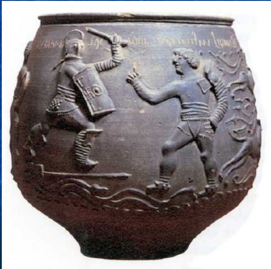
Гладиаторы. Рельеф на римской вазе.

Первое состязание гладиаторов состоялось в 264 г. до н.э. на поминках, устроенных сыновьями умершего римлянина. Там сражались три пары гладиаторов. В 65 г. до н.э. Юлий Цезарь, чтобы почтить память своего отца, вывел на арену 320 пар гладиаторов.