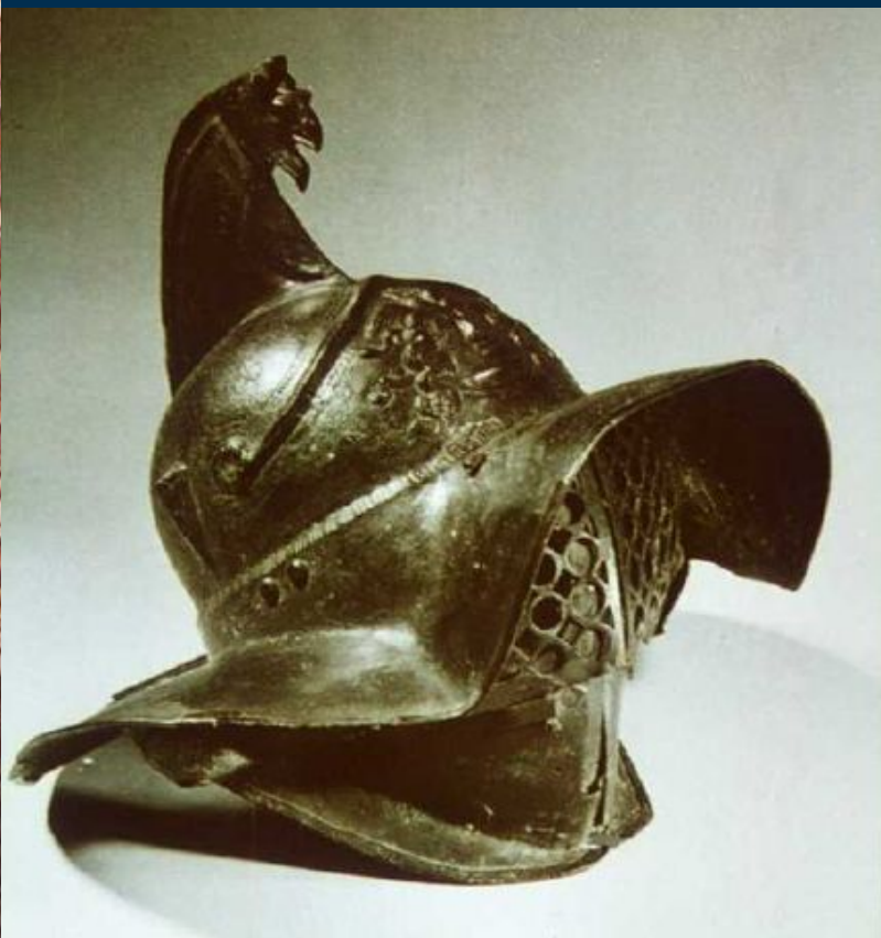
Шлем и оружие гладиаторов I век до н.э.

Вооружение гладиатора состояло из копья, меча – гладиуса, шлема, щита, наплечника (для особо храброго воина) и лат на ноги.