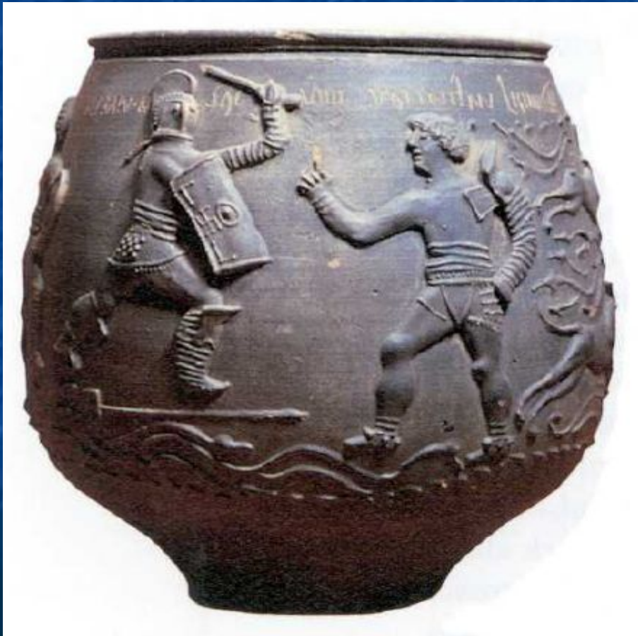
Гладиаторы. Рельеф на римской вазе.

Первое состязание гладиаторов состоялось в 264 г. до н.э. на поминках, устроенных сыновьями умершего римлянина. Там сражались три пары гладиаторов. В 65 г. до н.э. Юлий Цезарь, чтобы почтить память своего отца, вывел на арену 320 пар гладиаторов.