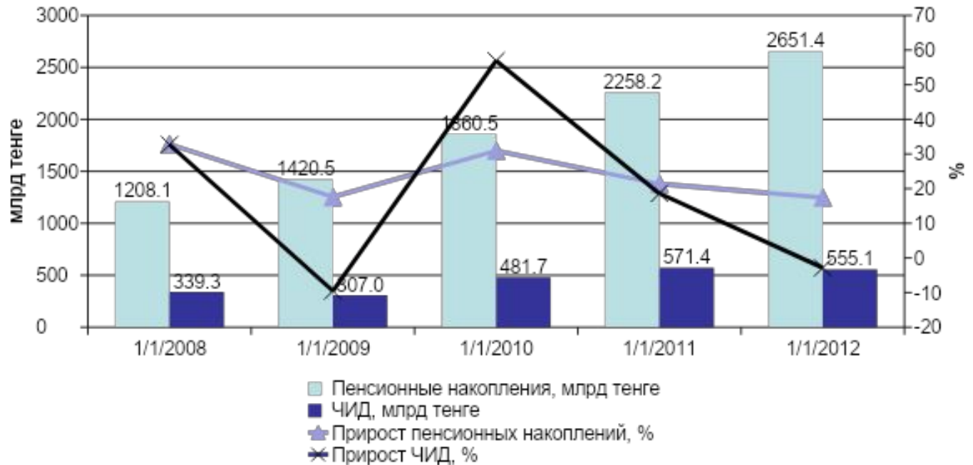
Динамика пенсионных накоплений и чистого инвестиционного дохода НПФ

На 01.01.2012 пенсионные накопления составили 2,65 трлн тенге (17,9 млрд долларов). Темпы роста основных количественных показателей стали ниже.