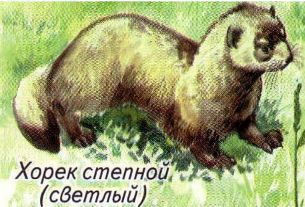
Хорек степной (светлый)