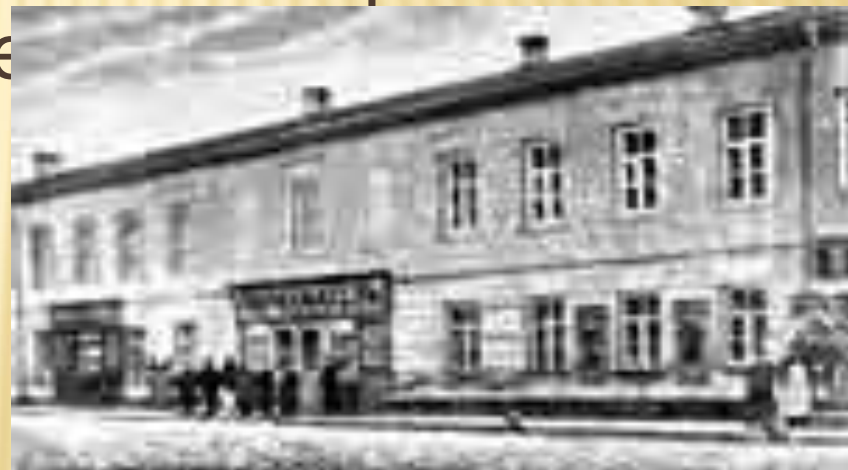
Дом на Немецкой улице в Москве ,где